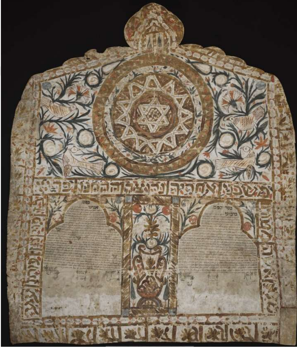
Tarihsel bir ketuba