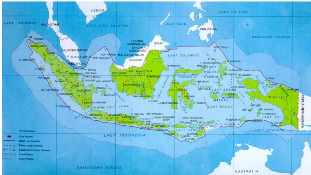
Resim 1.2: Endonezya tam haritası