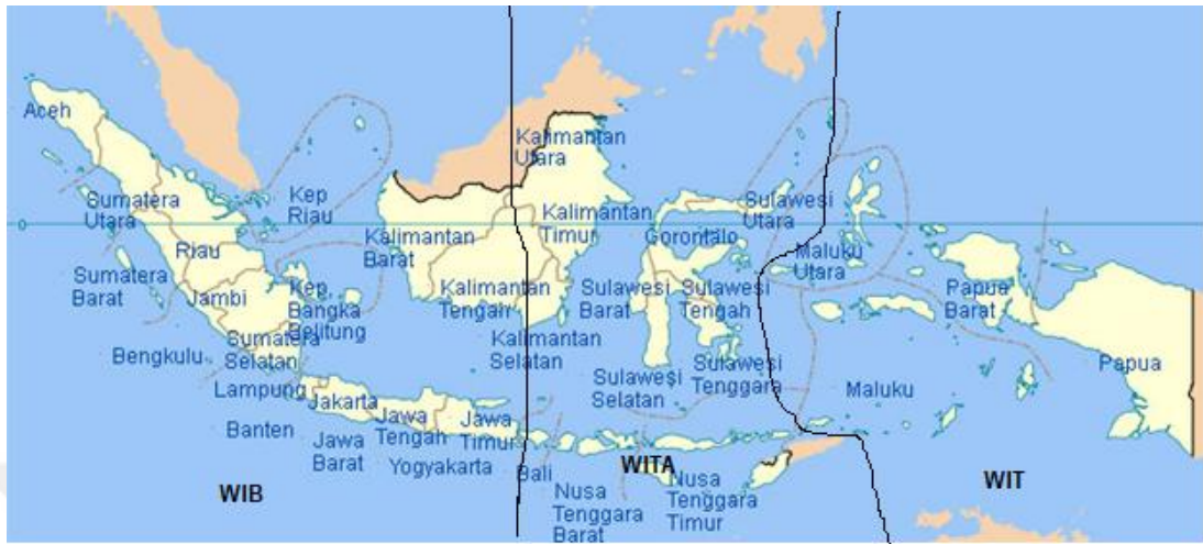
Resim 1.1: Endonezya’da saat dilimi ayrımlarının haritası

http://gusafira.blogspot.com/2014/03/pembagian-wilayah-waktu-indonesia.html