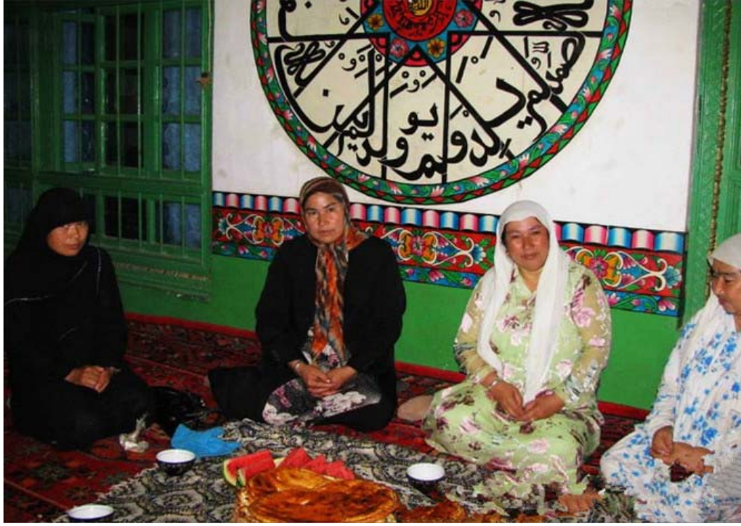
Kaynak kişilerden bazıları