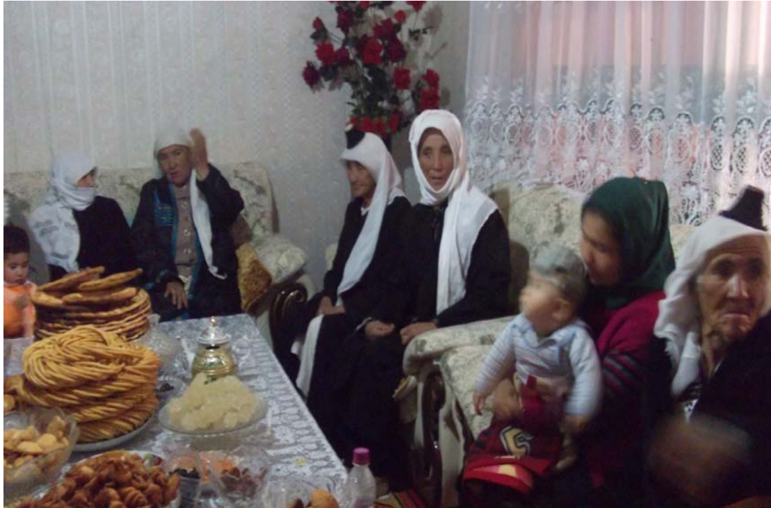
Düğüne gelen misafirler