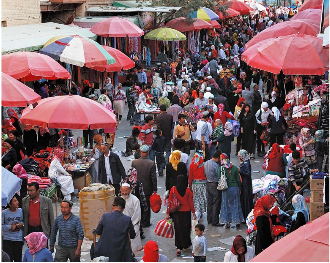
Köy sosyete pazarından bir görüntü