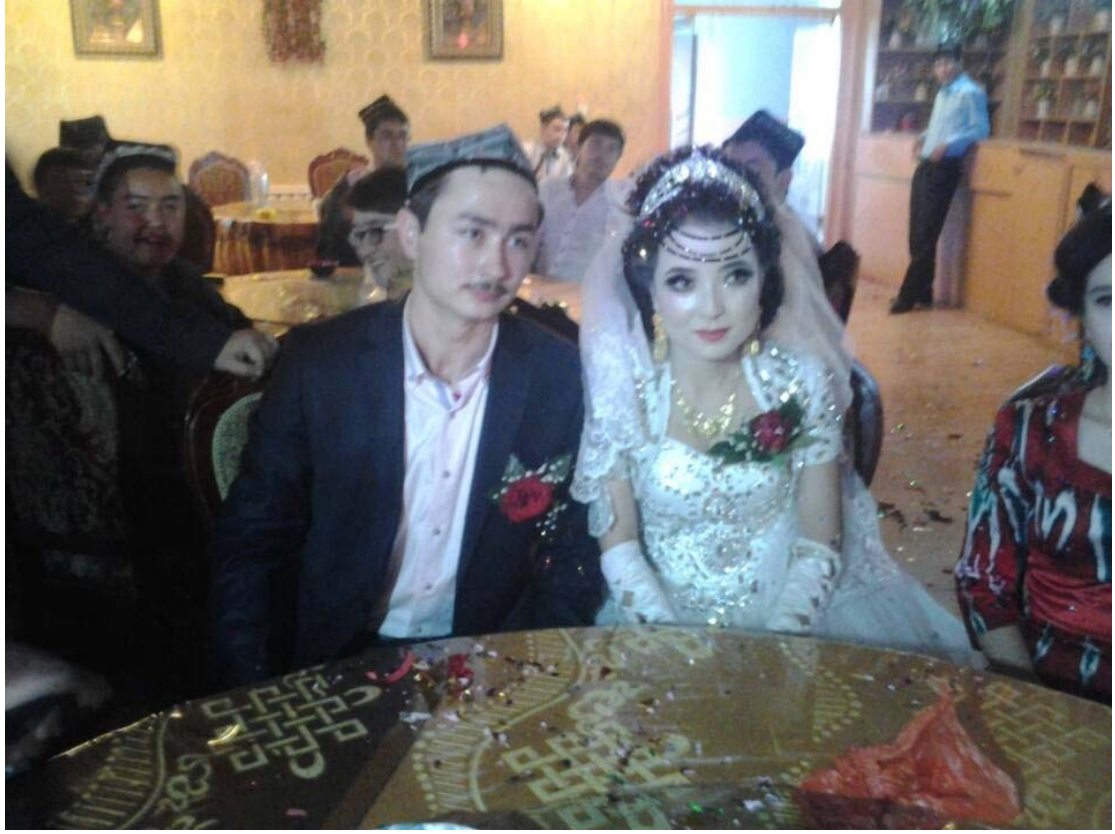
Yeni evlenen çiftler