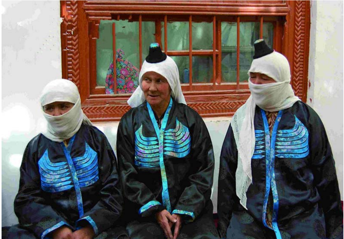
Hoten'in yöresel merasım kıyafetleri