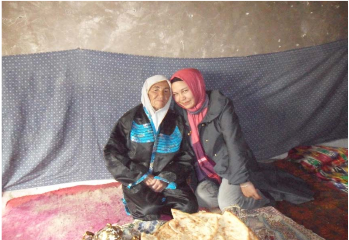
Çalışmamızdan bir hatıra fotoğraf