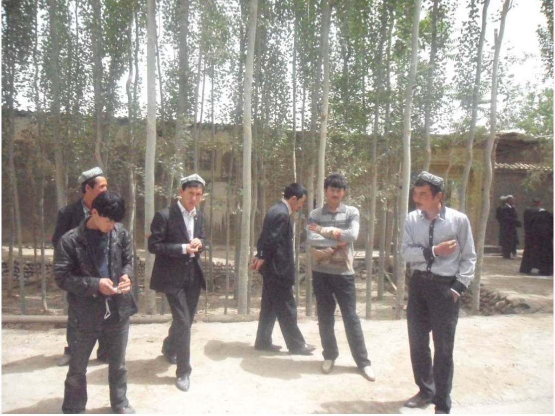
Düğün evine gelen damat arkadaşları