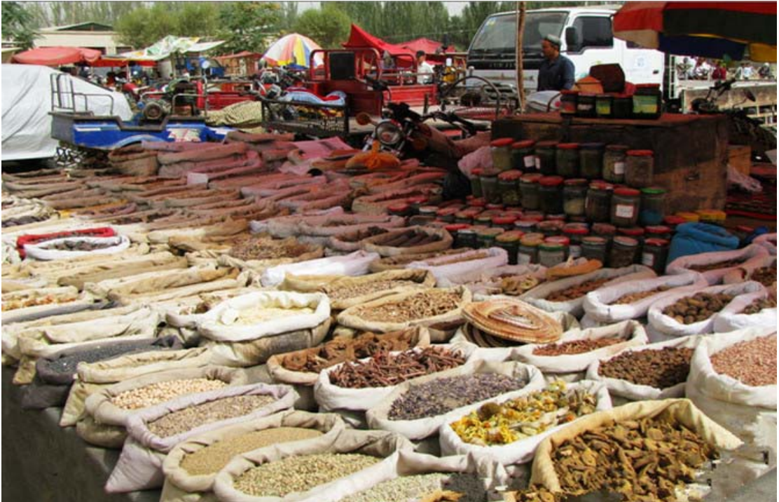
Hoten'in meşhur halk hekimliğinde kullanılan ilaçlı bitkiler, çaylar ve baharatlar