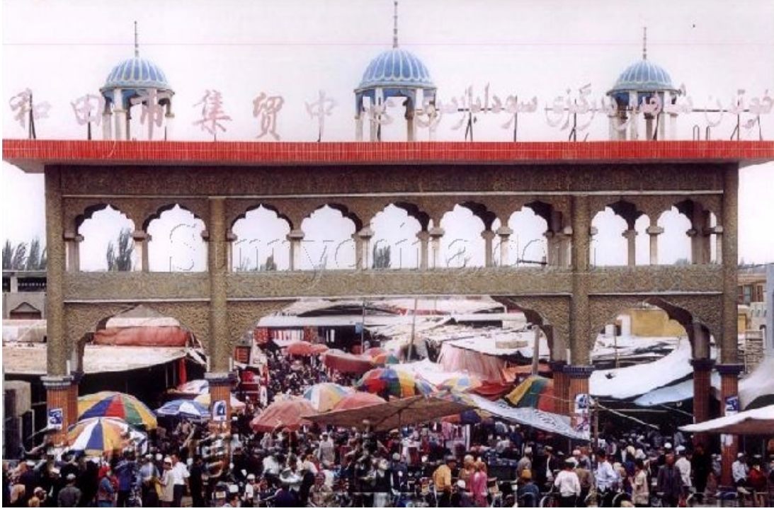
Hoten şehir merkezindeki çarşıdan bir görüntü