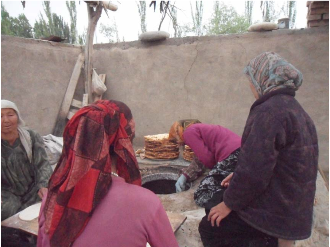
Köy ekmeği yaparken.