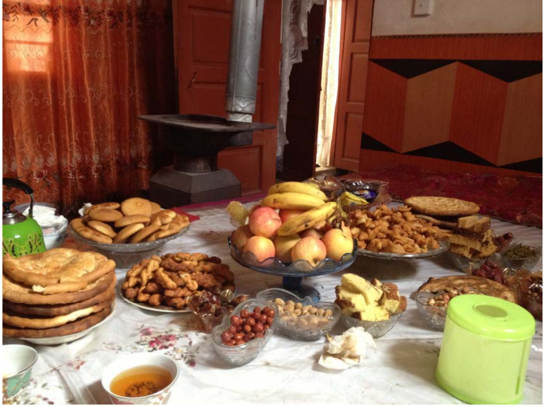
Sofralardan bir görüntü