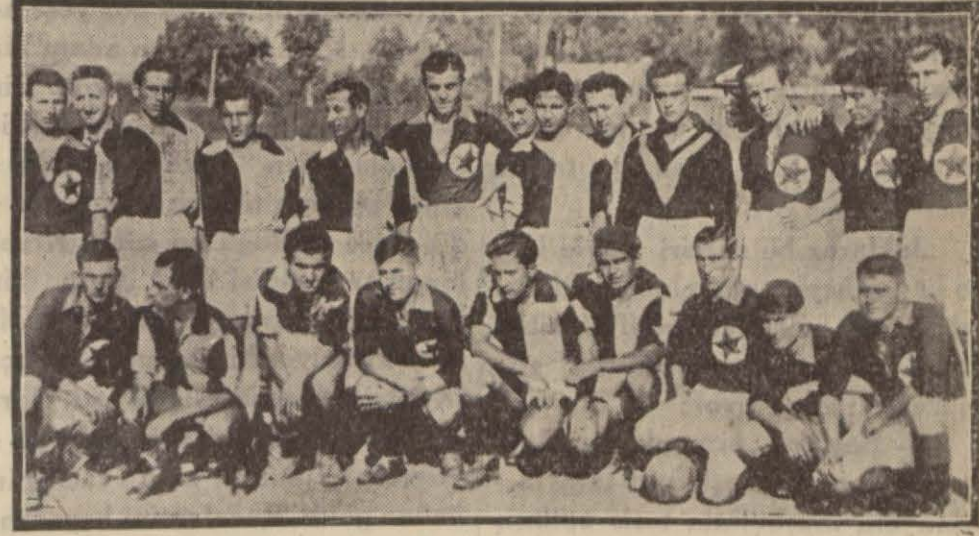
Kocaeli ve İstanbul şampiyonları bir arada

Kocaeli şampiyonu Adapazarı idman yurdunu tecrübesizlik yendirdi