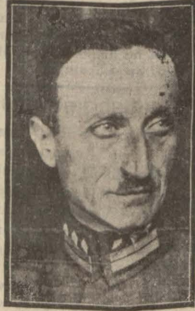
Gümrük umum muhafaza kumandanı Seyfi Paşa

man işleriyle meşgul olan resmî, yarı resmî ve hususî teşekküller on ikiyi bulur. Bunlar şunlardır: