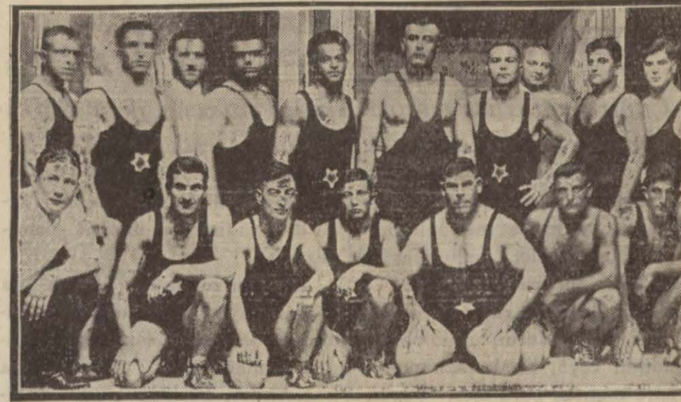
Dün İstanbul ve Ankara güreş şampiyonları karşılaşmışlar, neticeyi, ağır müstesna olmak üzere İstanbullular kazanarak Türkiye birincisi ilân edilmişlerdir.

Bu Faslı kadının burnunun üstünde gördüğünüz kalm çubukta baştan başa bir kur'anı kerim mahfuz imiş. Kur'anı taşıyacak başka bir yer bulamamış gibi bu kadının burnunda taşınması ancak kıyafetinin de gösterdiği garabet ve iptidallığın icaplarından olacak.