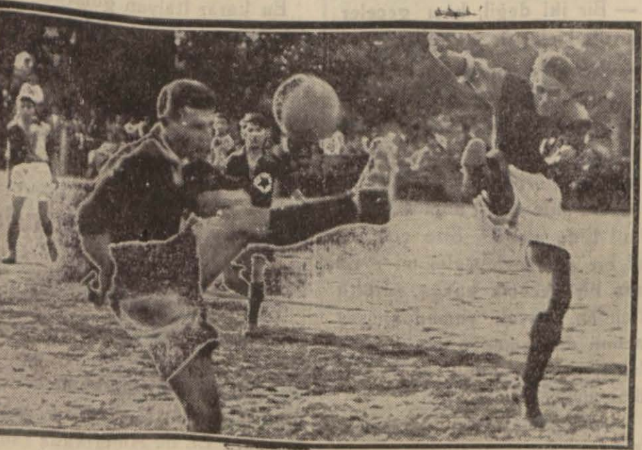
Adapazarı—İstanbul maçından bir görünüş