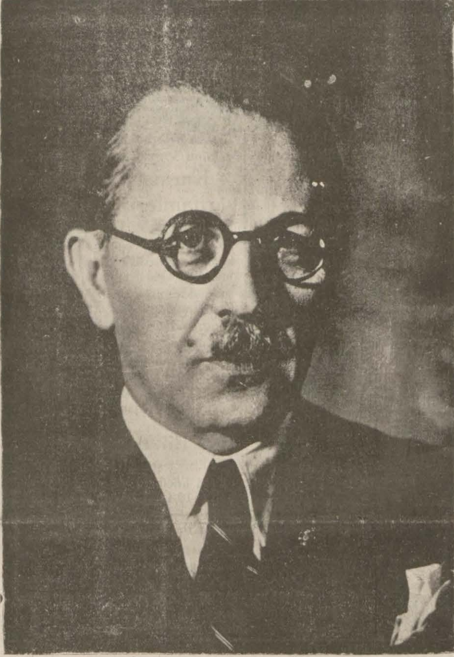
[Sayın Başvekilimiz] B. Şükrü Saracoğlu

Memurlara elbise — Mahdut gelirliyle yağ, pirinç, bulgur verilecek — Kumaşlar halka ucuz satılacak — Kömür vaziyeti — Şeker durumu — Buğday meselemiz — İhtikarla mücadele işlerimiz — Çiftçinin, tüccarın, büyük mülk sahiplerinin vereceği vergi — Türk parasını koruma mevzuu