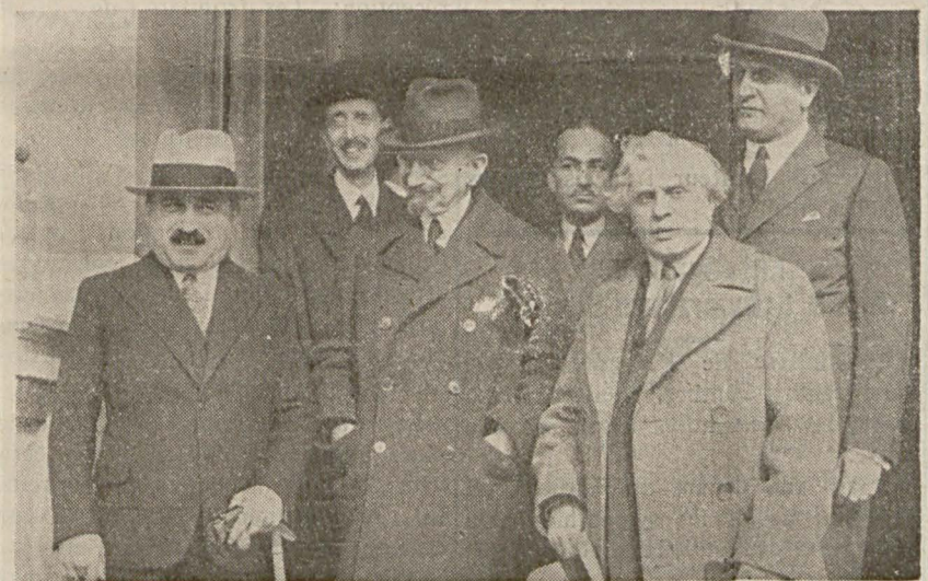
M. Paul-Boncour et M. Maximos reçus par M. Jevtić à la gare

Samedi, S. M. la Reine Marie a reçu en audience M. Paul-Boncour, ancien président du Conseil français.