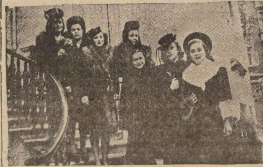
Nisanlaştı Akşam Kız Enstitüsünde dün bir defile tertip edilmiştir. Saat beşte başlayan defile saat on yediye kadar sürmüş, enstitü talebelerinin hazır oldukları yazlık, kışlık elbise tayyâr, manto ve iç eşyaları canlı modellerle beraber edilmiştir. Sadeliği esas tutan modeller hazır bulucuların takdirini kazanmıştır.

Resimimiz defileye iştirak edenlerden bir kısmını göstermektedir.