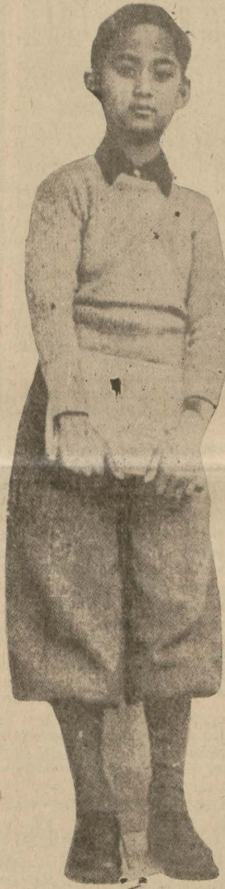
Siyam Kralı Ananda

ahırz ertesi gün bu vaziyet bir itizarla halka bildirilmiştir.