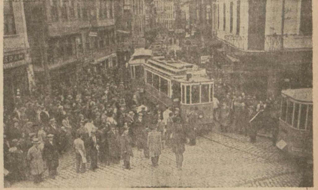
Tramvay şirketinin bozuk arabaları yüzünden şehrimizde her gün eksik olmuyor böyle kazalar