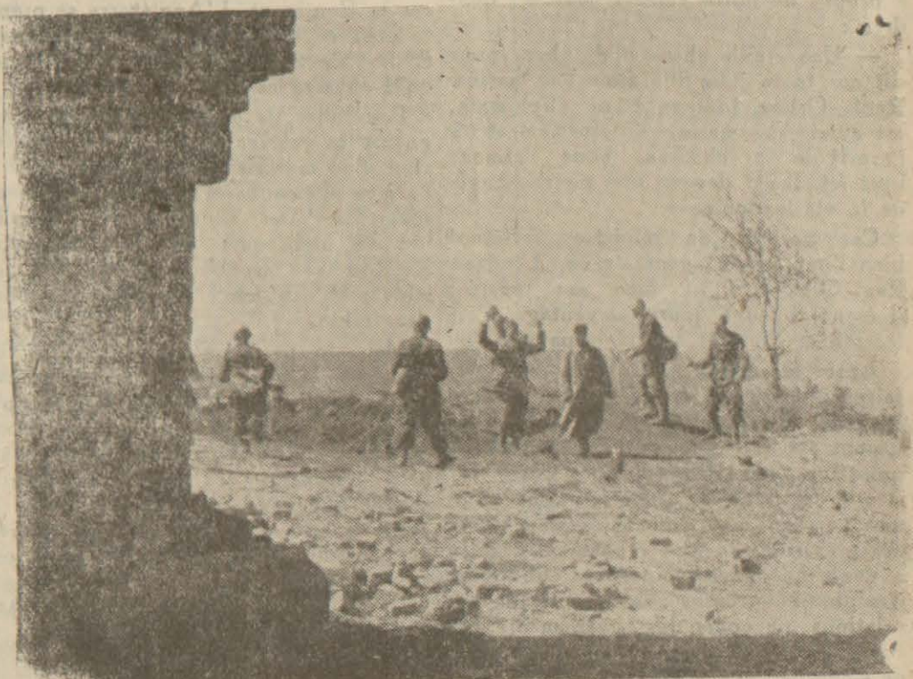
Soldats soviétiques faisant leur reddition aux troupes du Corps d'Expedition italien en URSS.

Dans le Kouban occidental, les Allemands ont occupé une colline