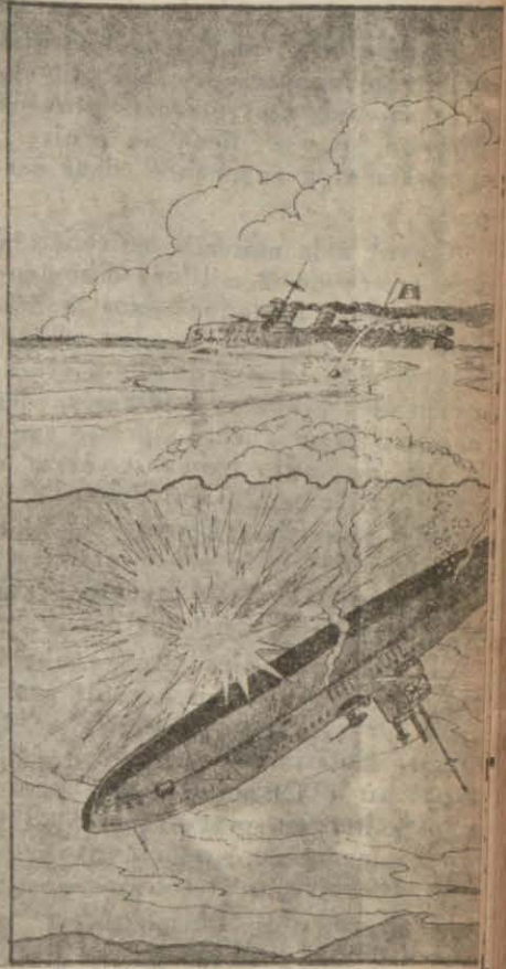
La destruction de deux destroyers par le communiqué No 648 du Grand Quartier général italien