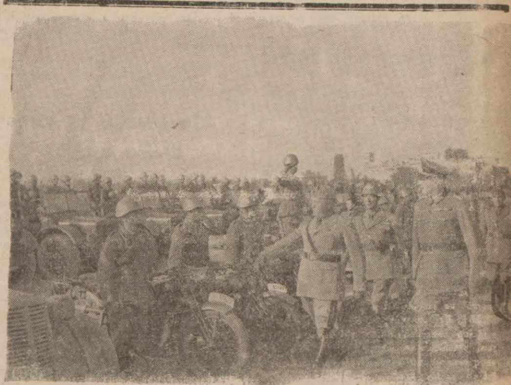
Le Duce passe en revue une grande unité motorisée du corps d'expédition contre l'URSS