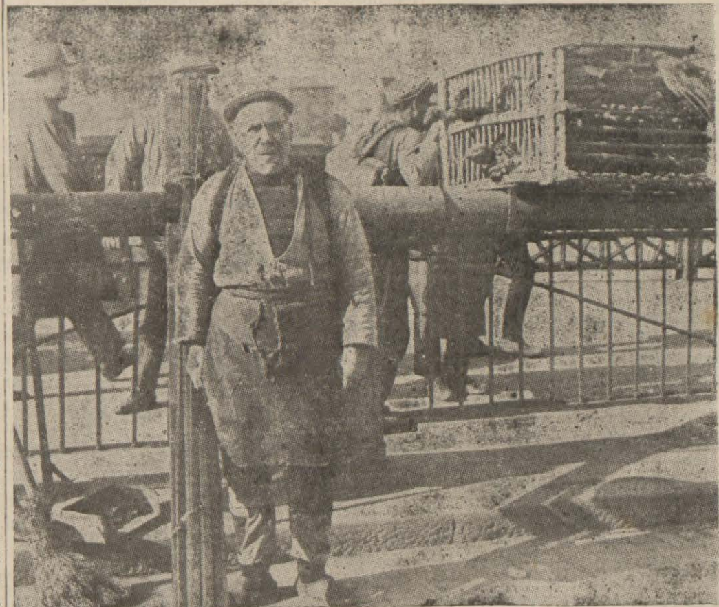
A l'approche de Noël, les dindes affluent de toutes les bases-cours de la province. Gavées de noix, engraisées avec amour, elles seront la gloire de la table du Réveillon

Cet accord aura effet rétroactif à par- tir du 10 octobre 1938.