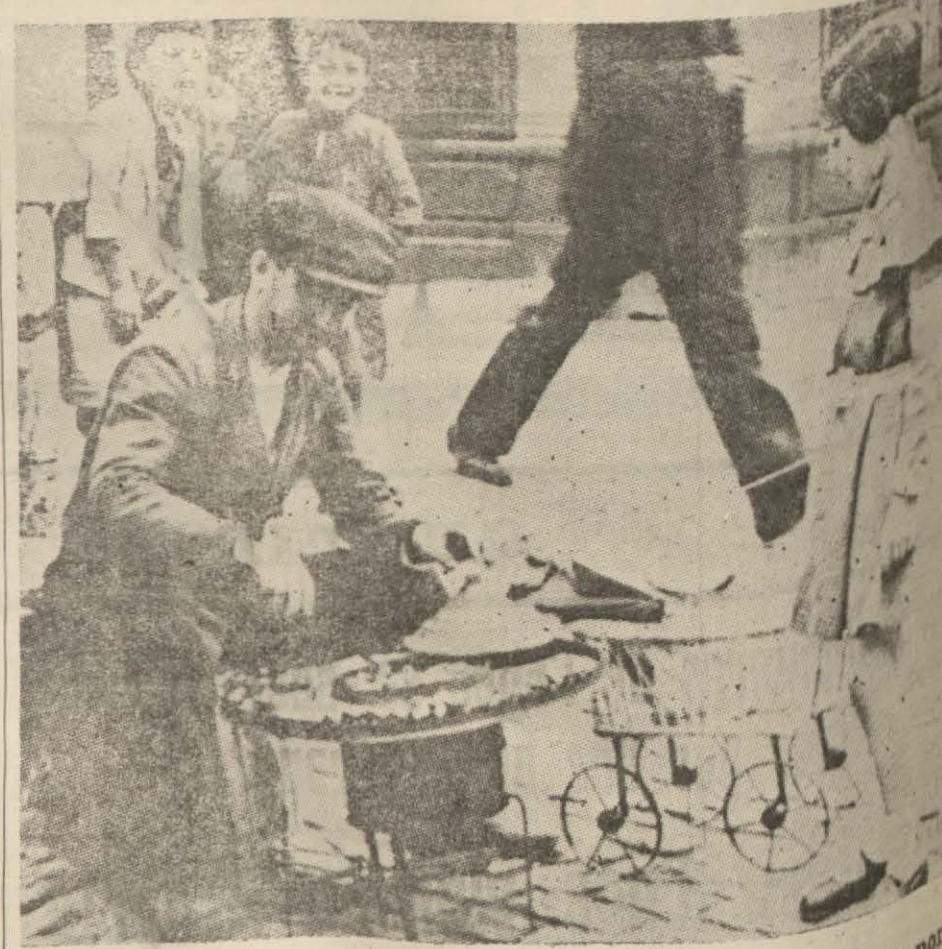
Les marchands de marrons ont paru : l'hiver est à nos portes

Le Congrès d'Histoire turque. — L'accord commercial franco-turc. — « L'Aiglon » à l'Opéra. — Pensées d'un Turc. — Secrets de beauté et de santé.