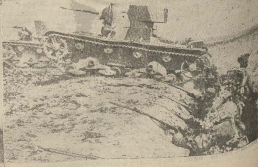
Quelques instantanés des manœuvres de l'Egée