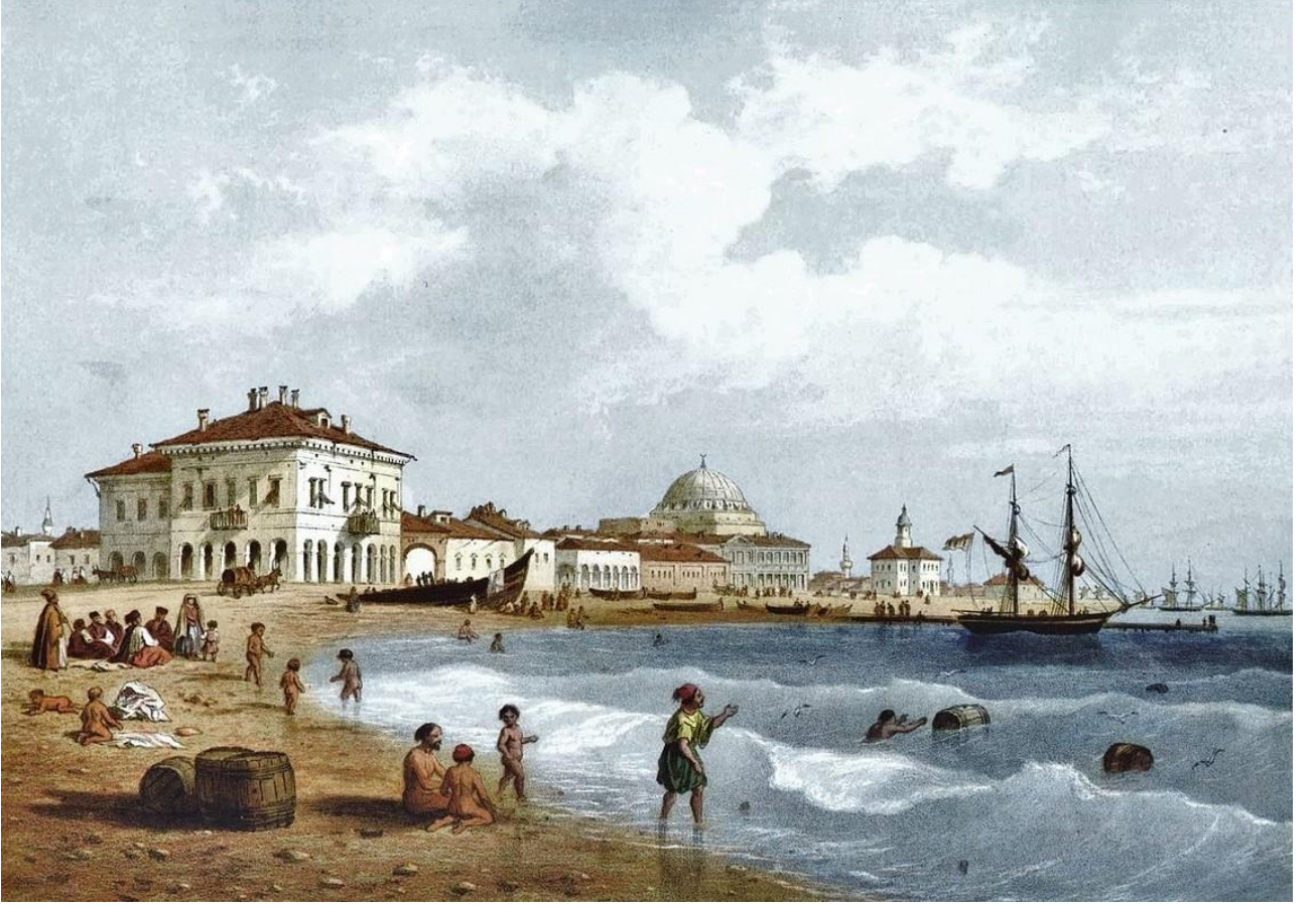
Resim: Carlo Bossoli-Yevpatoria (19.Yüzyıl)