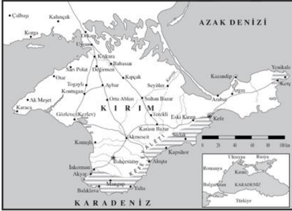
Harita: Kırım Haritası (Yılmaz, Kırım Hanlığı Kadı Sicilleri Kataloğu )