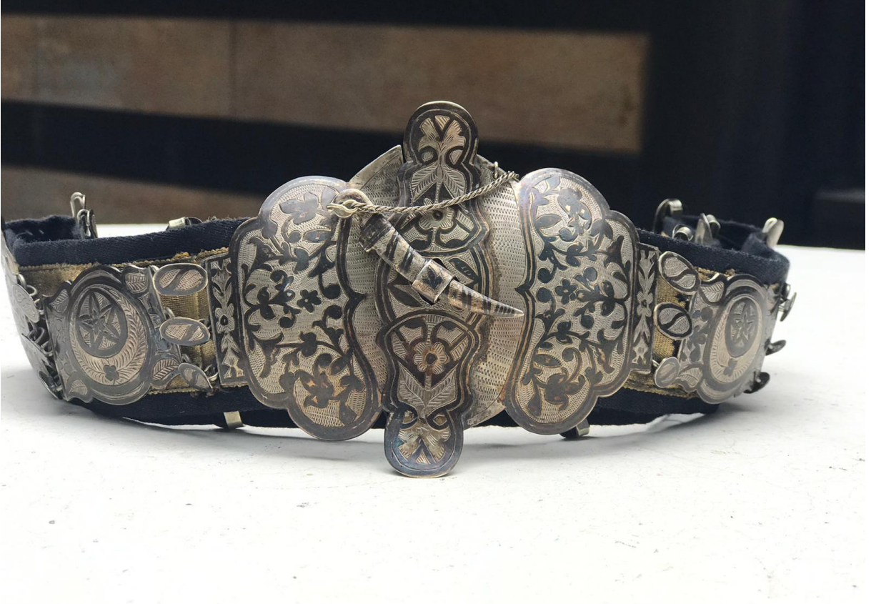
Fotoğraf 3: Kadın terekelerinde sıklıkla rastlanılan gümüş kuşağa bir örnek. Dört nesildir çocukları tarafından muhafaza edilen bu kuşak, 1886 doğumlu Kıırlı Zeleyha Tofan'a aittir.