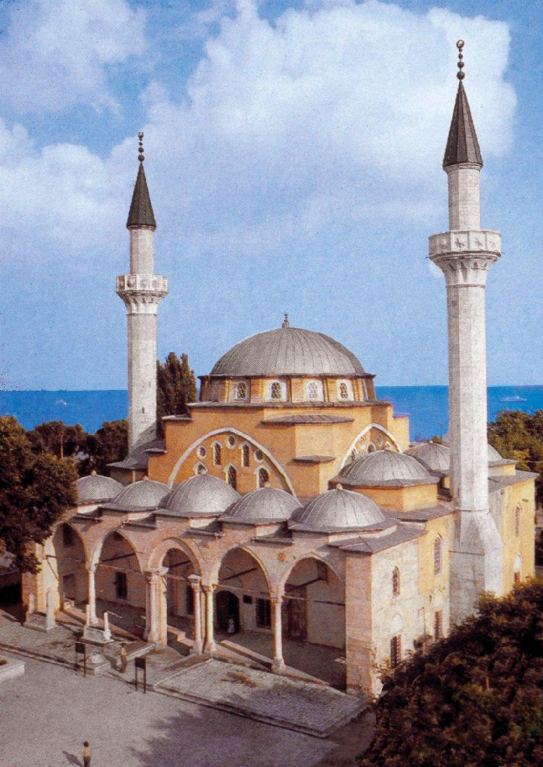
Fotoğraf 1: XVI. asrın ortalarında eski Fatih Camii'ne uygun olarak tasarlanan Mimar Sinan eseri: Tatar Han Camii-Gözle 410