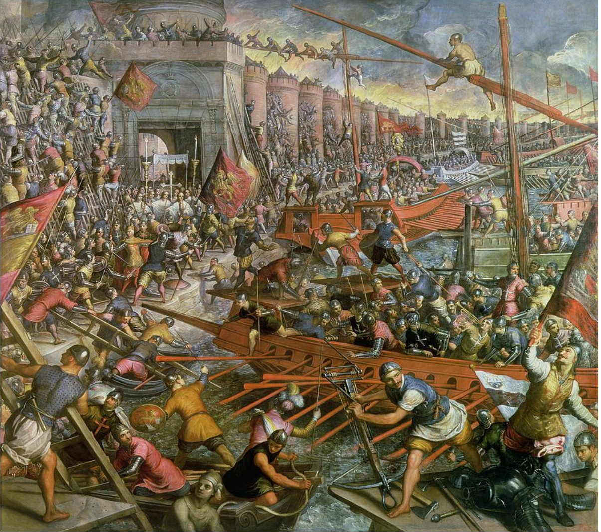
Ek 1: Haçlı ordusunun İstanbul'un Haliç tarafındaki surlara saldırılarını tasvir eden bir görsel. 738

https://upload.wikimedia.org/wikipedia/commons/8/80/Caduta_di_Costantinopoli.jpg