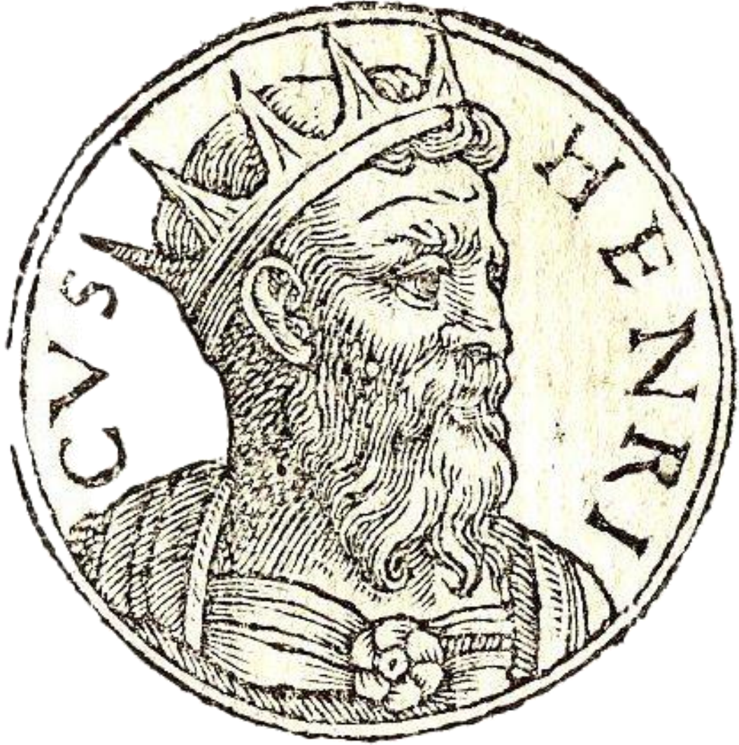
Ek 4: İstanbul Latin İmparatorluğu'nun ikinci hükümdarı: Henri de Constantinople. 739

https://upload.wikimedia.org/wikipedia/commons/5/51/Henri_I_-Flanders.jpg .