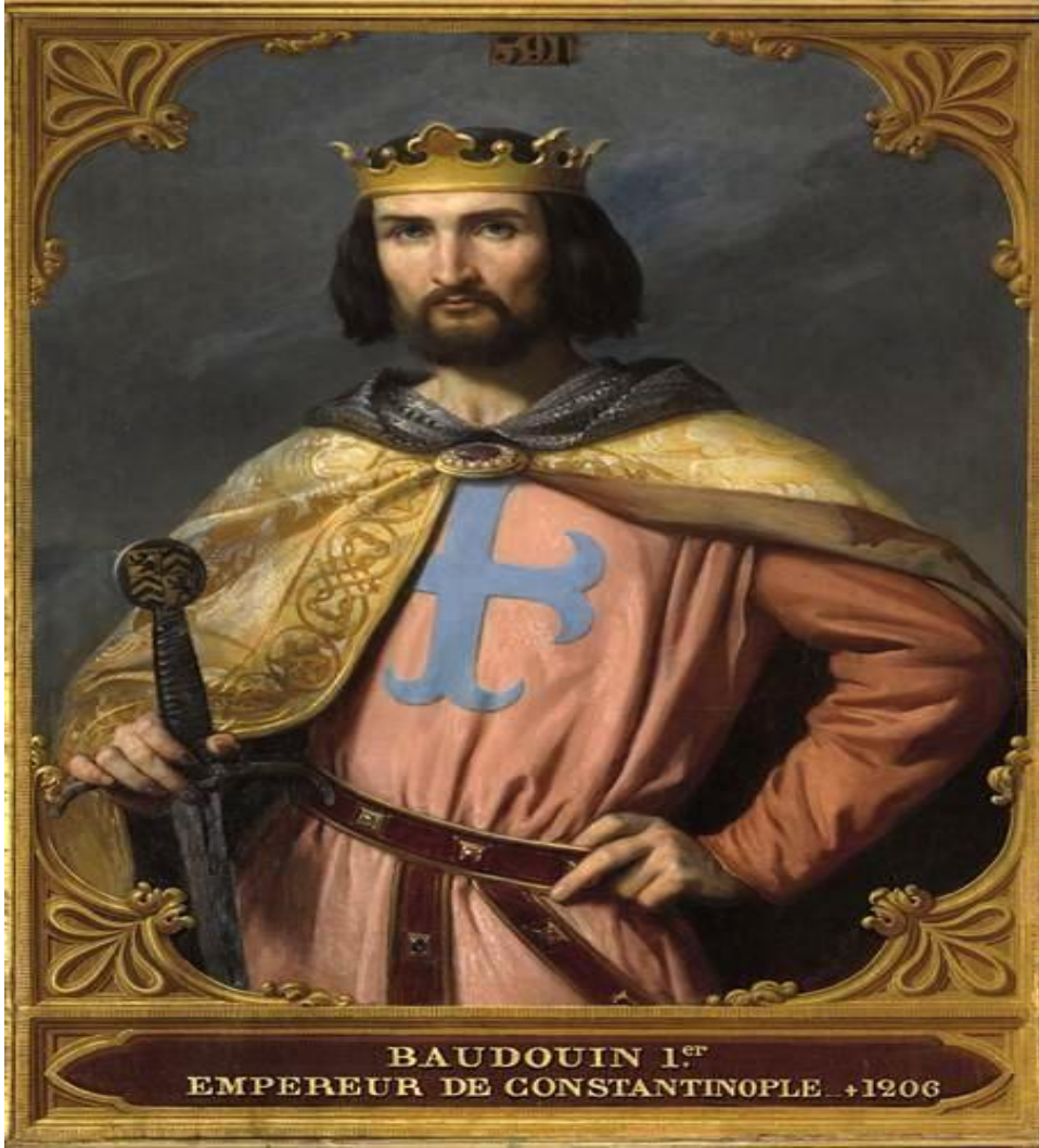
Ek 2: İstanbul Latin İmparatoru I. Baudouin'in Versay Sarayı'nda yer alan bir tablosu.

http://collections.chateauversailles.fr/#2730fa2a-98d5-490d-b3ff-8789bb79f37b