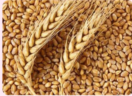
Resim 6: Bereket.

Torununun doğum haberi bir müjdecici ile Abdumuttalib'e ulaştırıldı. Abdumuttalib hemen geldi ve torununu kucağına alarak Kâbe'ye gitti. Yüce Allah'a (c.c) şükretti ve bebeğe "Muhammed" ismini verdiğini duyurdu. Daha sonra torununun doğumu şerefine bir ziyafet verdi. 8