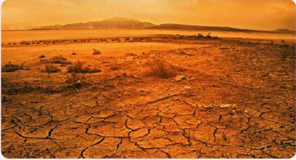
Resim-10: Mekke'de kuraklık yılları.

Abdulluttalib böyle duâ ederken bütün halk da içtenlikle "Amin!" diyordu. Peygamberimiz (s.a.v) de ellerini yüce dergâha açmış, "Yağmur yağdır Allah'ım." diye dua etmişti. Onun, sevgili dedesinin duasına "Amin" dediğini, ardından da dua ettiğini gören halk, büyük bir ümitle bakınmaya başladı.