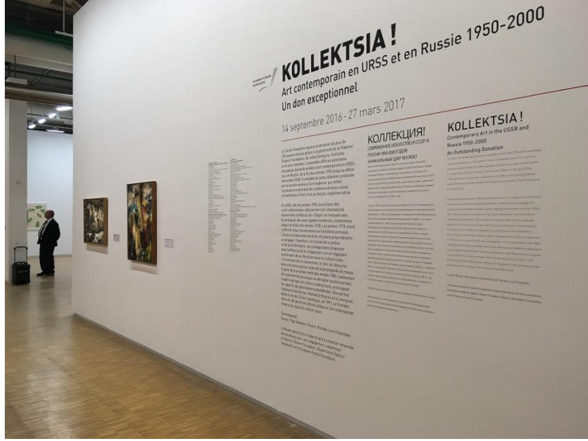
Şekil 24: “Koleksiyon” SSCB ve Rusya’da Modern Sanat 1950-2000: Müze’ye Özgün Hediyesi” bir projesi. Le Centre Pompidou, Paris.

Kaynak: http://www.theartnewspaper.ru/posts/3420/ , 16.07.2018