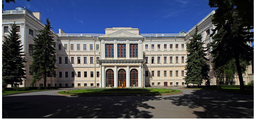
Şekil 9: Anichkov Sarayı. St. Petersburg