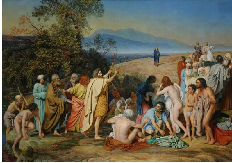
Şekil 12: “İsa'nın İnsanlara Görünüşü” (1837-1857). Ressam A.A. Ivanov. Tretyakov Sanat Galerisi

Kaynak: https://www.culture.ru/materials/38436/iisus-dolzhen-byt-odin-sovershenno , 25.10.2017