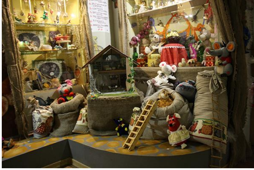
Şekil 19: Fare Müzesi. Mishkin şehri. Yaroslavl bölgesi.