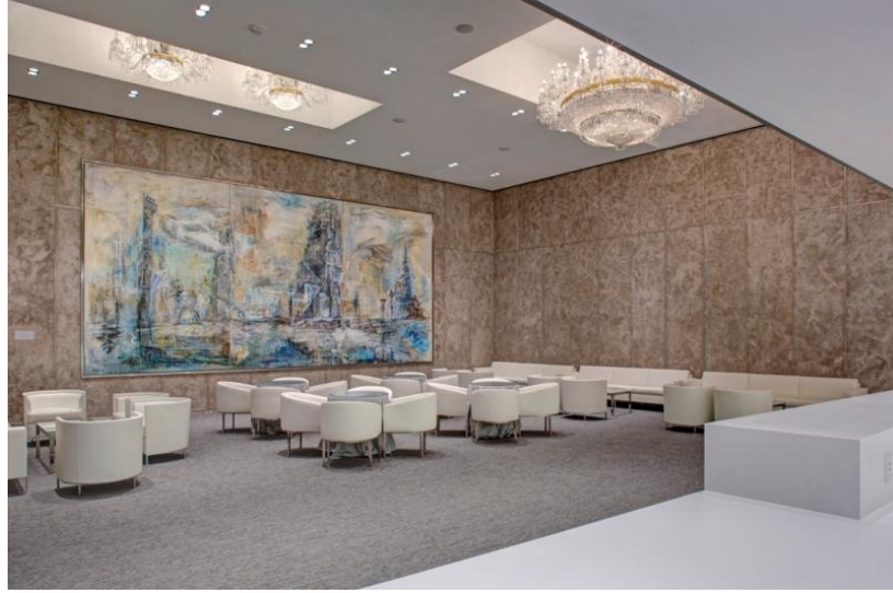
Şekil 23: Rus Oturma Odası. Kennedy Merkezi, Washington, DC.