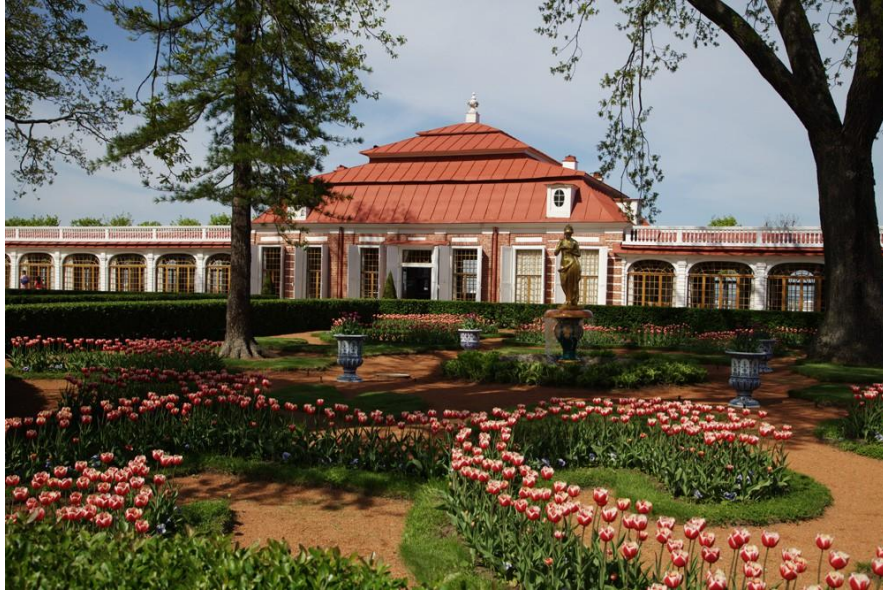
Şekil 1: Monplaisir Palace, Peterhof, St. Petersburg