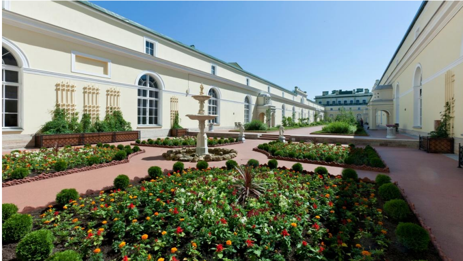
Şekil 5: Küçük Ermitaj. 1764-1766 yy. Mimarı U.M.Veldten.

Kaynak: http://www.hermitagemuseum.org/wps/portal/hermitage/explore/buildings/locations/building/B20/?lng=ru , 22.09.2017