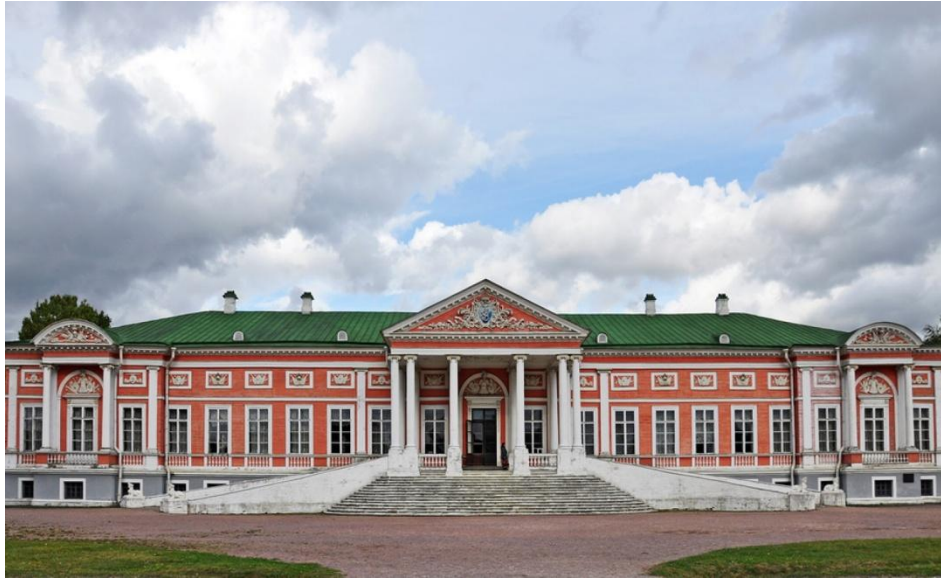
Şekil 6: Kuskovo Sarayı. Moskova. (16. yüzyılın sonundan itibaren)