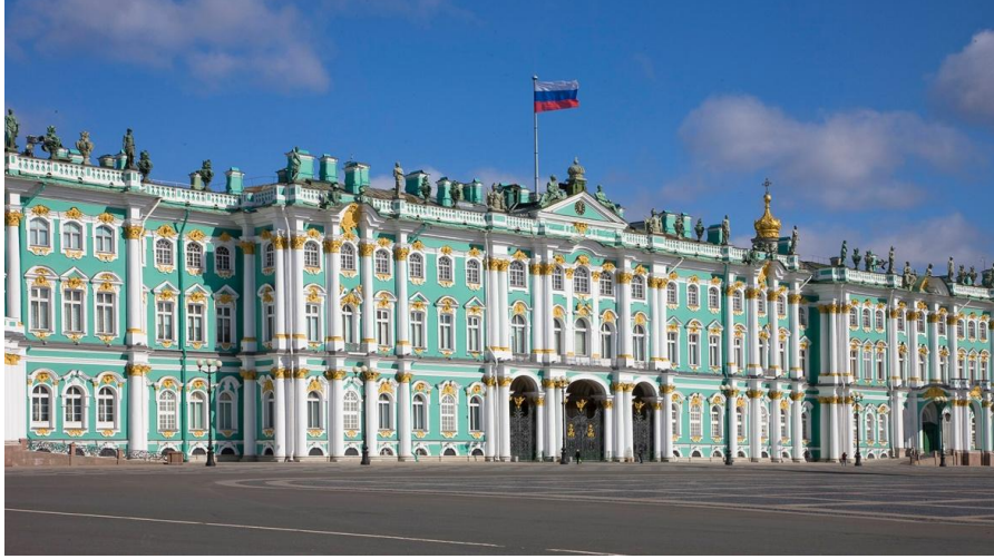
Şekil 4: Kış Sarayı, Ermitaj Müzesi, St. Petersburg. 1754-1762 yy. Mimarı Bartolomeo Francesco Rastrelli.

Kaynak: http://www.hermitagemuseum.org/wps/portal/hermitage/explore/buildings/locations/building/B10/?lng=ru , 22.09.2017