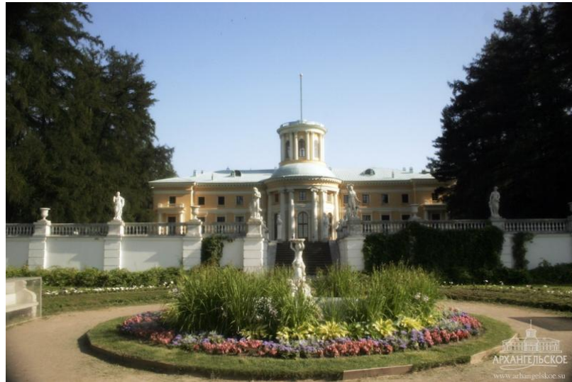
Şekil 2: Arkhangelskoye Palace, St. Petersburg