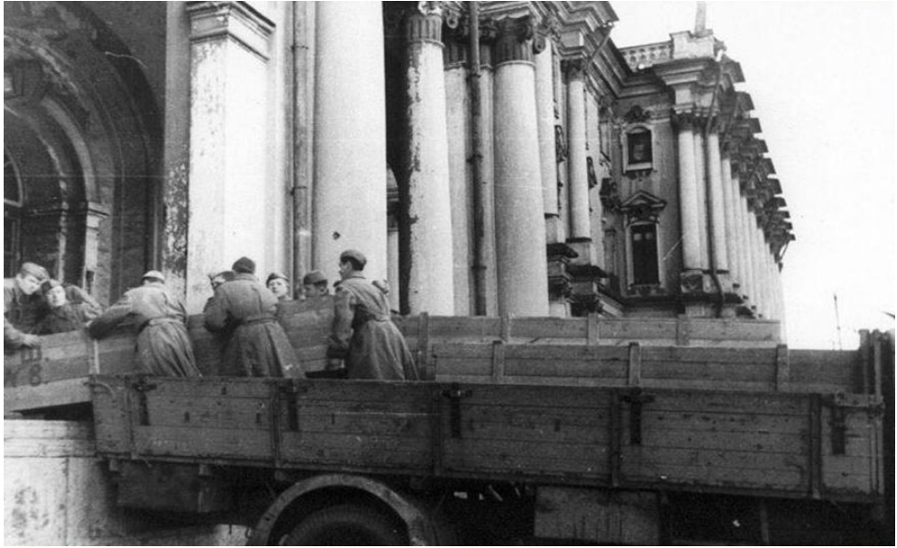
Şekil 16: Ermitaj Müzesi tahliye sırasında

Kaynak: https://www.edu.ru/news/eksklyuzivny/ermitazh-istoriya-zhizni/ , 25.01.2018