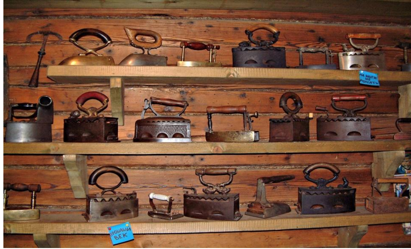
Şekil 20: Ütü Müzesi. Pereslavl-Zalessky şehri. Yaroslavl bölgesi.