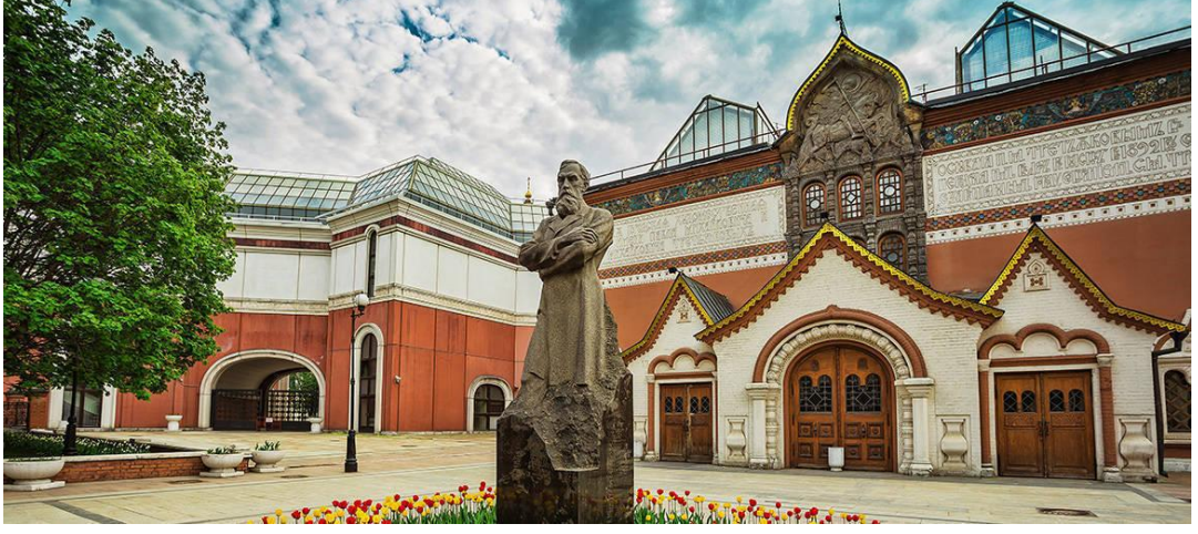
Şekil 13: Tretyakov Sanat Galerisi (1856 y.). Moskova. Kurulan: Pavel Tretyakov