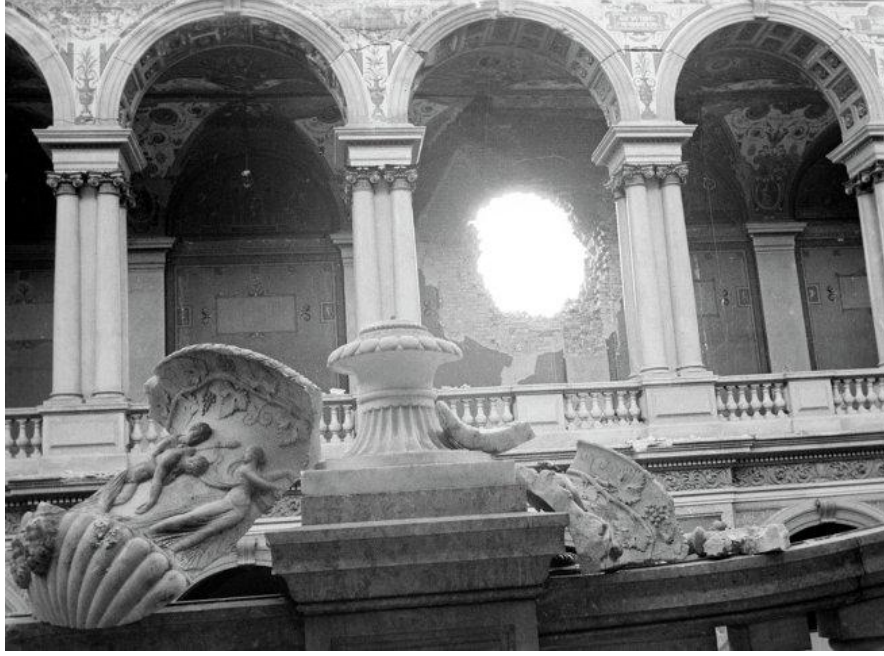
Şekil 17: Ermitaj Müzesi bombalama sırasında