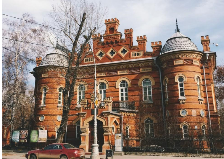
Şekil 7: Irkutsk Müzesi. (Yeni bina, 1883)