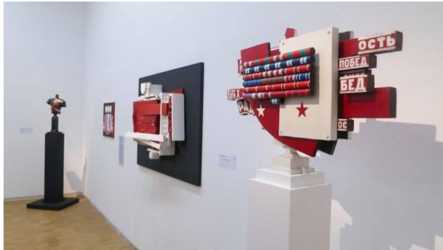
Şekil 25 : “Koleksiyon” SSCB ve Rusya’da Modern Sanat 1950-2000: Müze’ye Özgün Hediyesi” bir projesi. Le Centre Pompidou, Paris.

Kaynak: http://art-lestnica.ru/?category_name=articles&paged=5 , 16.07.2018