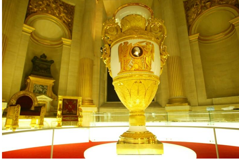
Şekil 21: Sergi “Rusya ne zaman Fransızca konuştu: Paris-Saint Petersburg, 1800-1830”. Paris, Les Invalides, Mayıs, 2003.

Kaynak: http://museum.fondpotanin.ru/symphony/paris , 16.07.2018