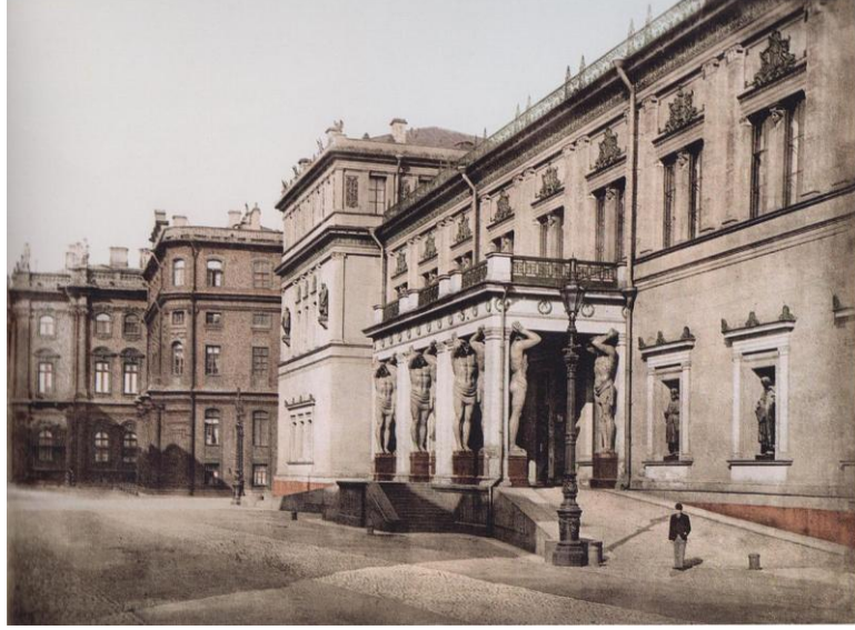
Şekil 8: Yeni Ermitaj. St. Petersburg. Mimarı Leo von Klenze (1839-1852)

Kaynak: http://opeterburge.ru/sight/novyj-ermitazh.html , 15.10.2017