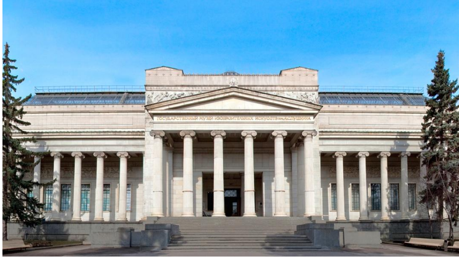
Şekil 15: Puşkin Devlet Güzel Sanatlar Müzesi (Moskova Üniversitesi Güzel Sanatlar Müzesi)

Kaynak: https://pushkinmuseum.art/museum/buildings/main/index.php?lang=ru , 21.04.2019