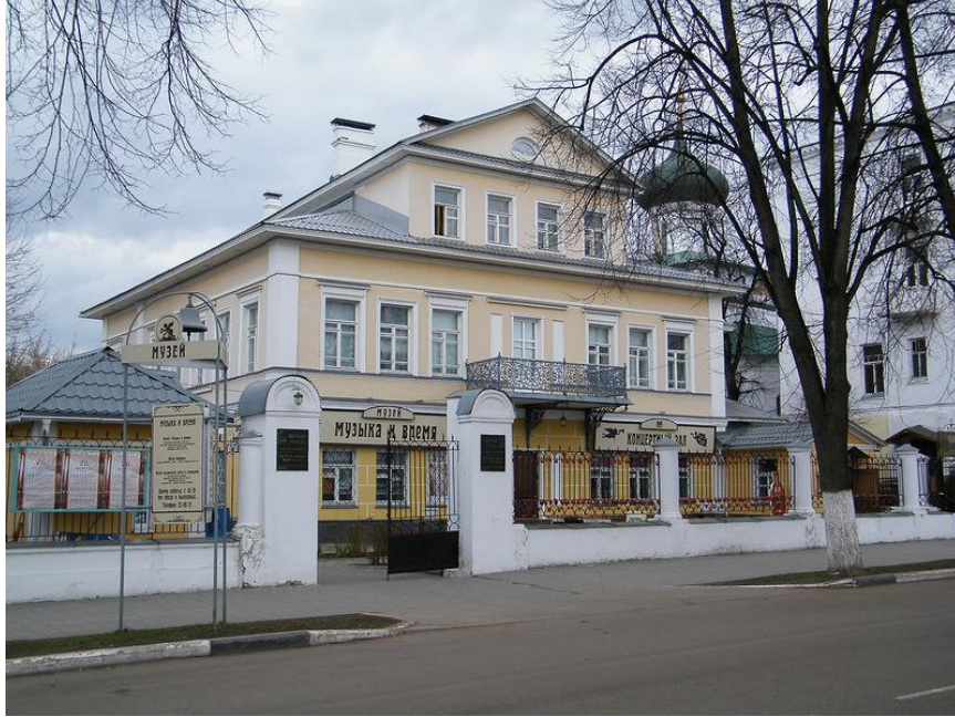
Şekil 18: Özel müze "Müzik ve Zaman". Yaroslavl, Rusya.

Kynak: https://wikiway.com/russia/yaroslavl/muzey-muzyka-i-vremya/photo/ , 17.04.2018