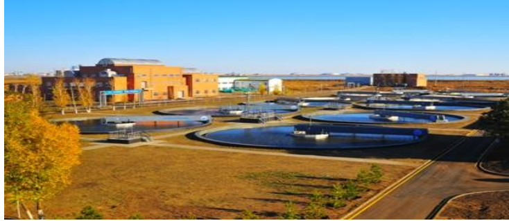
Kazakistan Taldykol Göl Rehabilitasyonu ve Atık Su Arıtma Tesisi, Aslim Alarko