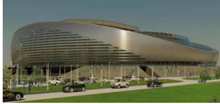
Astana Stadyumu, Sembol İnşaat