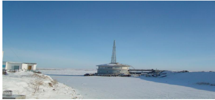
Kazakistan Astana Su Projesi, Aslim Alarko