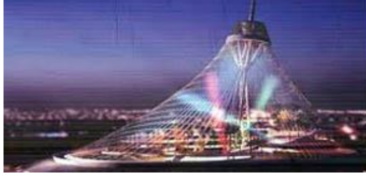
Han Çadırı AVM, Sembol İnşaat