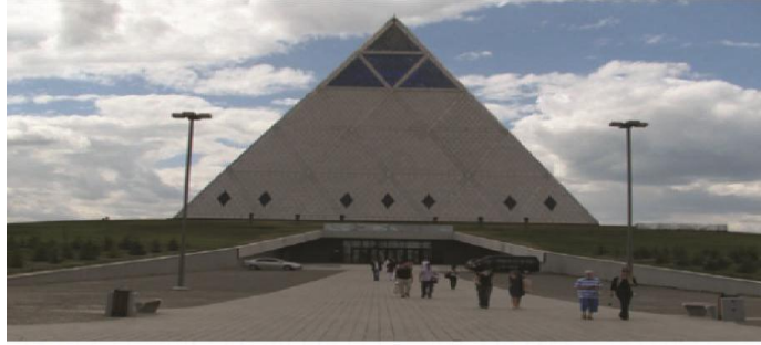
Piramit, Sembol İnşaat