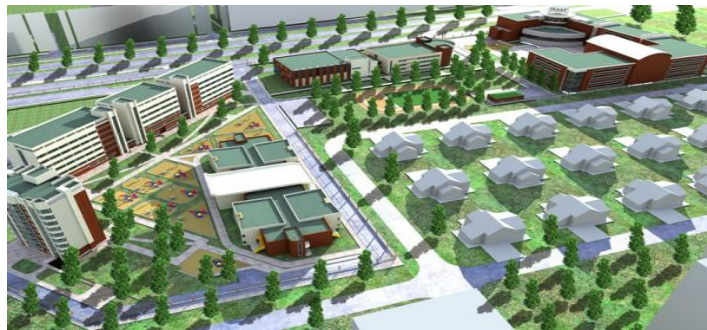
Kazak-Türk Lisesi, Sembol İnşaat