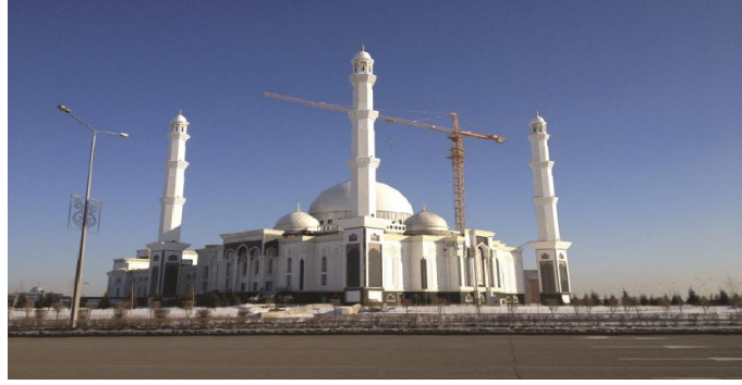
Hazreti Sultan Camii, Sembol İnşaat