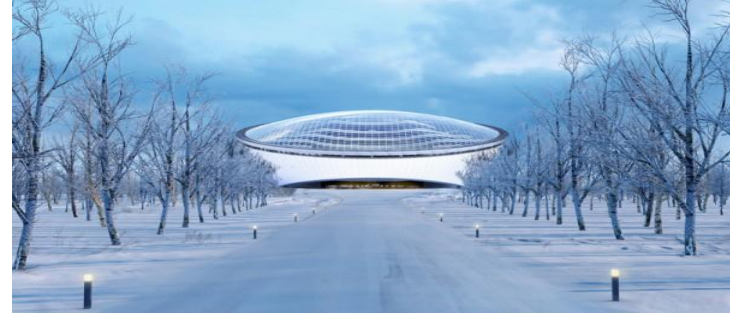
Kazakistan Cumhuriyeti İlk Cumhurbaşkanı Vakfı ve Kütüphanesi, Sembol İnşaat