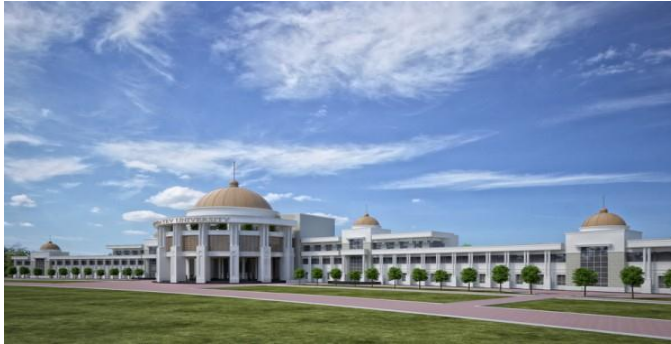
“Nazarbayev Üniversitesi” Araştırma Eğitim Kompleksi. Mevcut rektörlük ve ana binaları. Cephe rekonstrüksiyonu, Sembol İnşaat