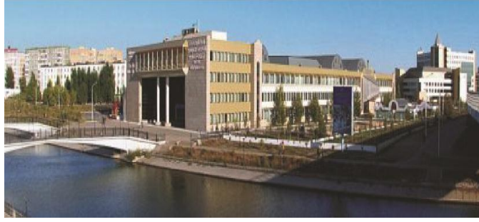
Evrazya Üniversitesi, Sembol İnşaat