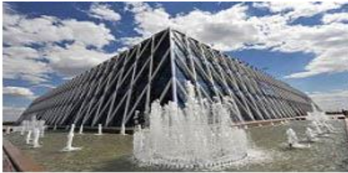
Bağımsızlık Sarayı, Sembol İnşaat