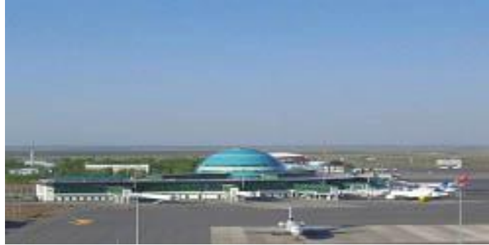
Astana Hava Alanı, Sembol İnşaat