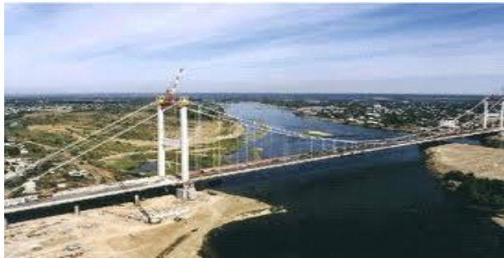
Semipalatinsk'teki Köprü, Aslim Alarko