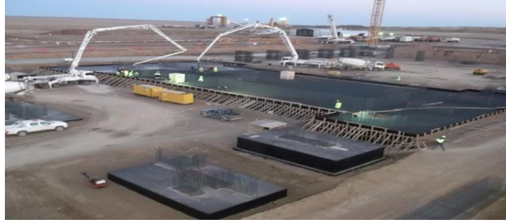
Kazakistan Bozshakol Bakır Konsantre Tesisi, Aslim Alarko