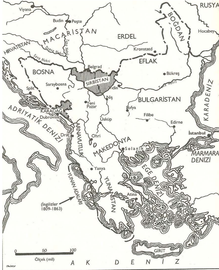
Şekil 2 – Osmanlı Balkanları, 1815 135

Avrupa'yı sonra dünyayı etkilediği bir dönem olarak belirtilebilir. Bu süreçte Avrupa'da sanayi devrimi kurumsallaşmış, yeni bir ticaret sınıfı olan burjuvazi ekonomik ve siyasi bir aktör olarak ortaya çıkmış, kentli yoksulların sınıf bilinci kazanmasıyla Marks ve Engels'in Komünist Manifesto'da bahsettiği "komünizm hayaleti" Avrupa'nın her yerinde dolanmaya başlamış ve bu dinamiklere Fransız