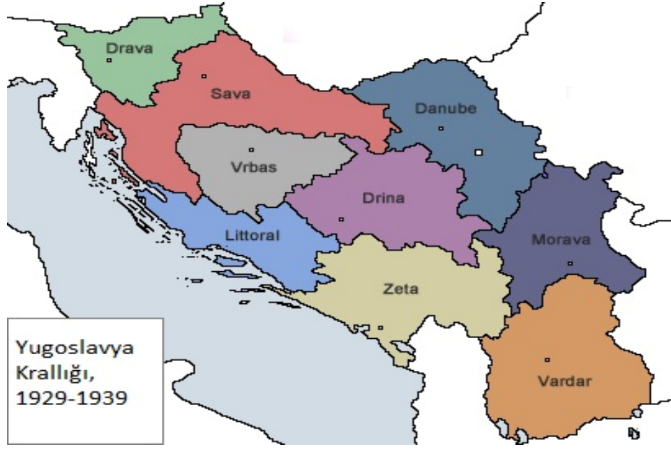
Şekil 5 Yugoslavya Krallığının 9 idari bölgesi - 1929

artık 9 idari bölgeden yönetilecekti, bu 9 bölge her hangi bir tarihi veya etnik özelliklere göre değil coğrafi, ekonomik faktörlere göre belirlenmişti. 292