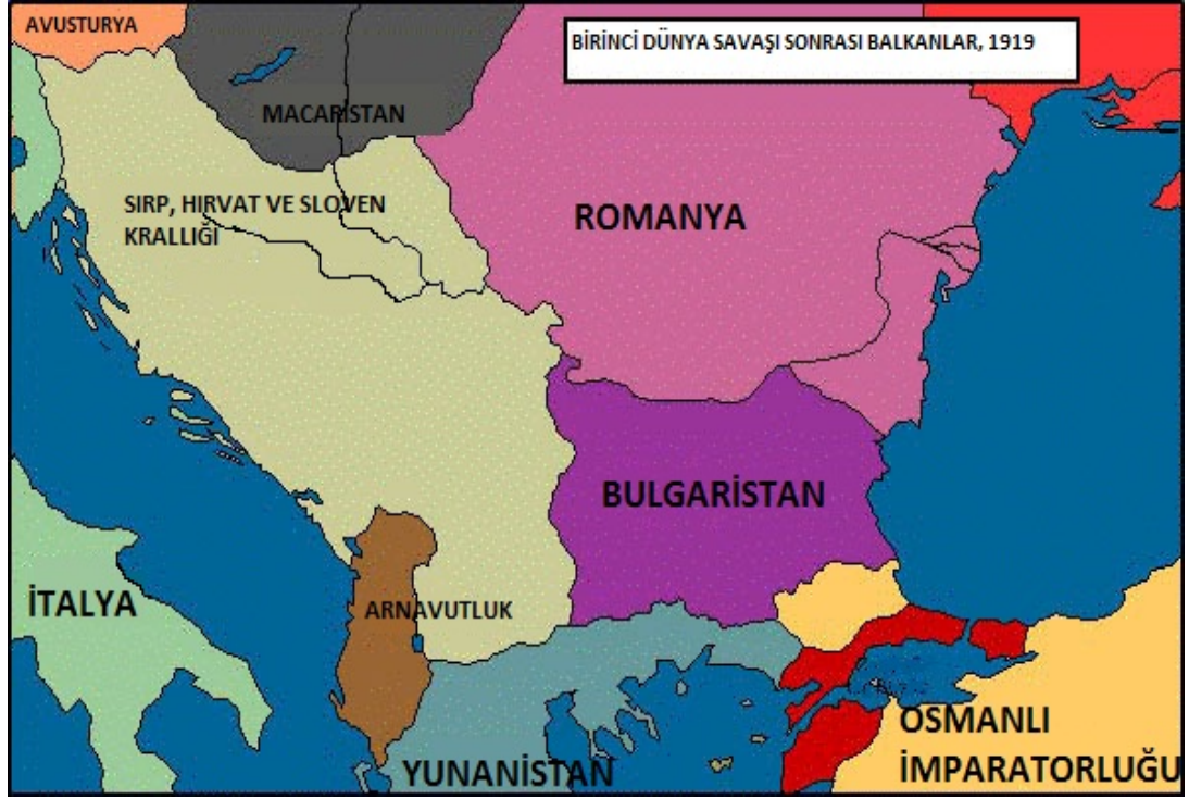
Şekil 4 Sırp, Hırvat ve Sloven Krallığı - 1919

Bu noktada iki dünya savaşı arası dönemde iki önemli sürecin birbiriyle iç içe geçerek mücadele içersinde oldukları söylenebilir. Kendi milli kimliklerinden, kültürlerinden ve siyasal geleneklerinden vazgeçemeyip bunun yanında siyasal konumlarını kendi milli çıkarlarına göre şekillendiren kurumsal örgütlenmeler ve gruplar ile Yugoslav millet inşa sürecini benimsemeyen ve bunu üretmeye çalışan kurumsal yapılar ve gruplar arasında cereyan eden mücadele sonucu birbirinden farklı birkaç değişik Yugoslavyacılık ideolojisi üretilmiştir.