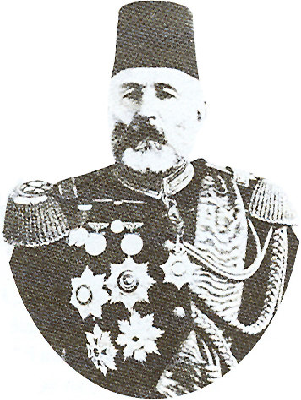
Ek 19: Müşir Recep Paşa