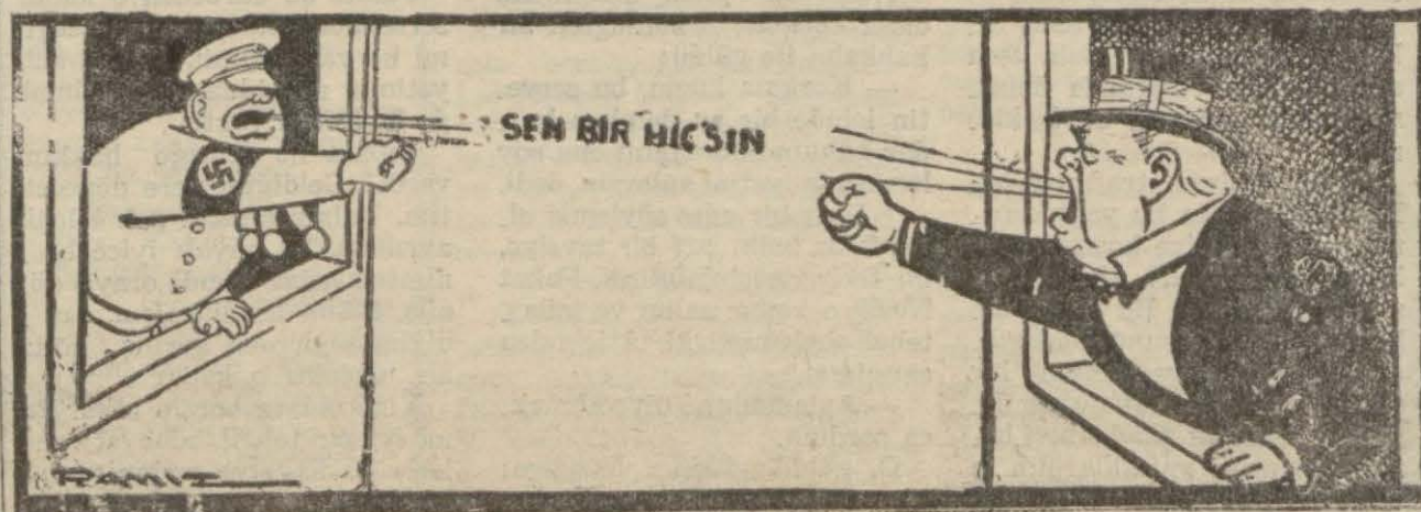
Siyaset cephesinde: Mahalle kaogası