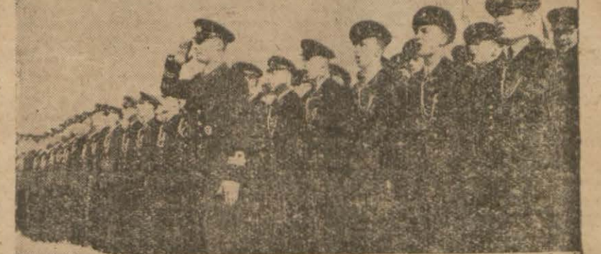
Yukarıda: Mezun talebeye diplomaları tevzi edilirken Aşağıda: Deniz Harp okulu talebeleri İstiklâl Marşını söylerken — Yazısı beşinci sahifemizde —