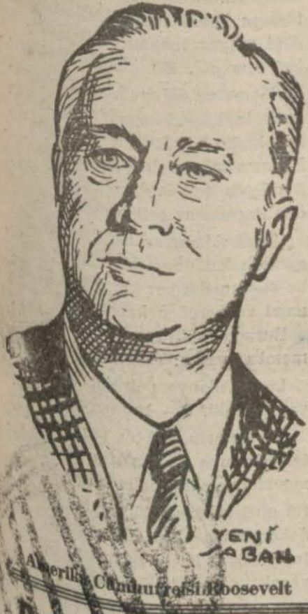
Amerika Cumhurbaşkanı Roosevelt

Evvelâ silâhların tahdidi ve serbest ticaretin inkişafı