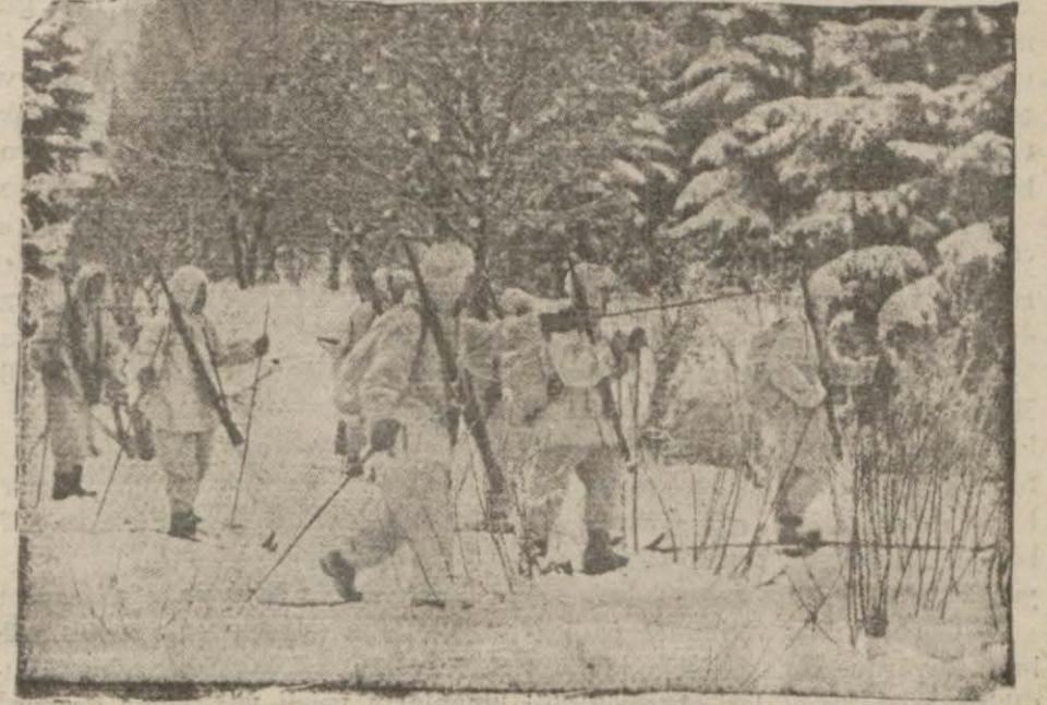
Fin askerleri avcı maddında

Kareli berzahında şiddetli muharebeler devam ediyor