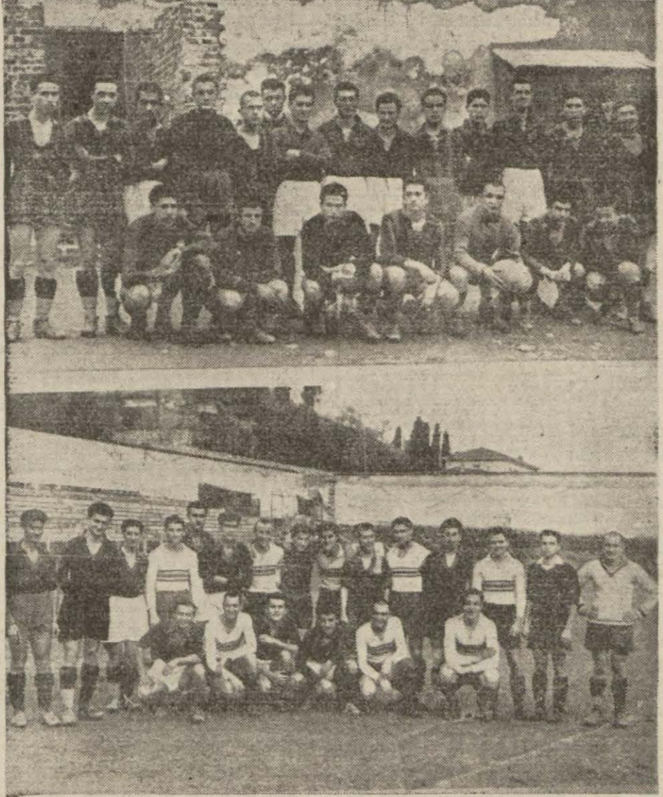
Boğaziçi - Yucaözü ve Darıuşşafaka - Kabataş takımları

Fatih Halkevinde dün bir resim sergisi açılmıştır. Teshir edilen tablolar sergiyi gezenler tarafından takdirle karşılanmıştır. Sergi her gün ziyaretçilere açık tutulacaktır.