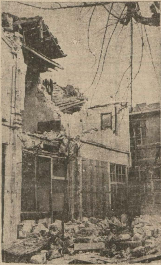
Karadeniz kıyısında zelzeninin yaptığı tahribattan bir görünüş

Dahiliye Vekili zelzele felâketi hakkında birçok hatiplerin sordukları suallere cevap verdi