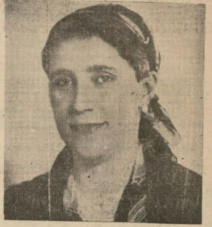
Sevimli ve Uğurlu EHM PİYANGO KRALLIĞI NİMET ABLA