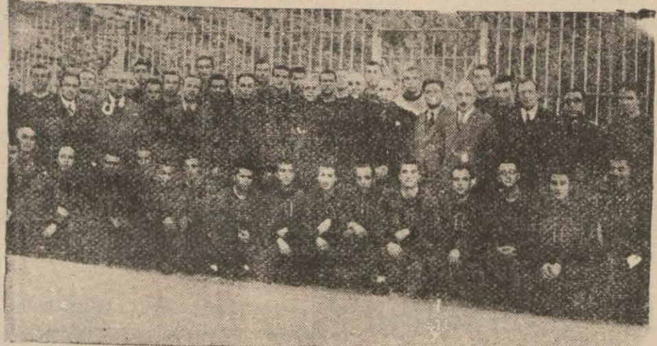
Beden Terbiyesi Eğitmen Kursu talebeleri

Felâket mıntakalarında vaktinde yardım teşkilatları bulunamaması yüzünden cemiyetin kurtarılması işi ne garib bir ciltedir ki yine aynı cemiyetin mahkûm ettiği kimselere havale edilmiş zarureti hasıl olmuş ve şu insanlar da hayatlarını feda eden