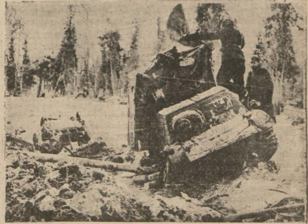
Finler tarafından tahrib edilen bir Sovyet tankı

Finlandiyalılar dün de yeni Rus hücumlarını püskürttüler