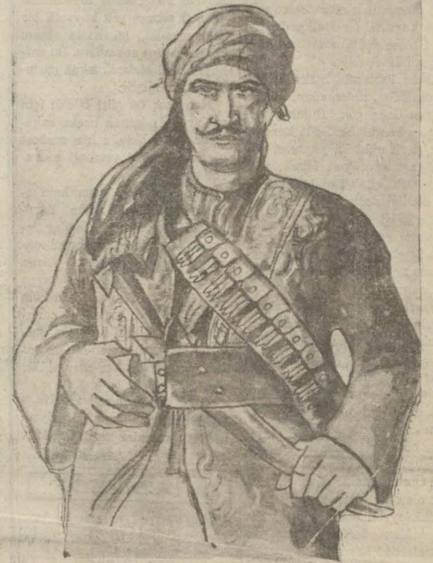
Gaziantep kahramanlarından bir tip...