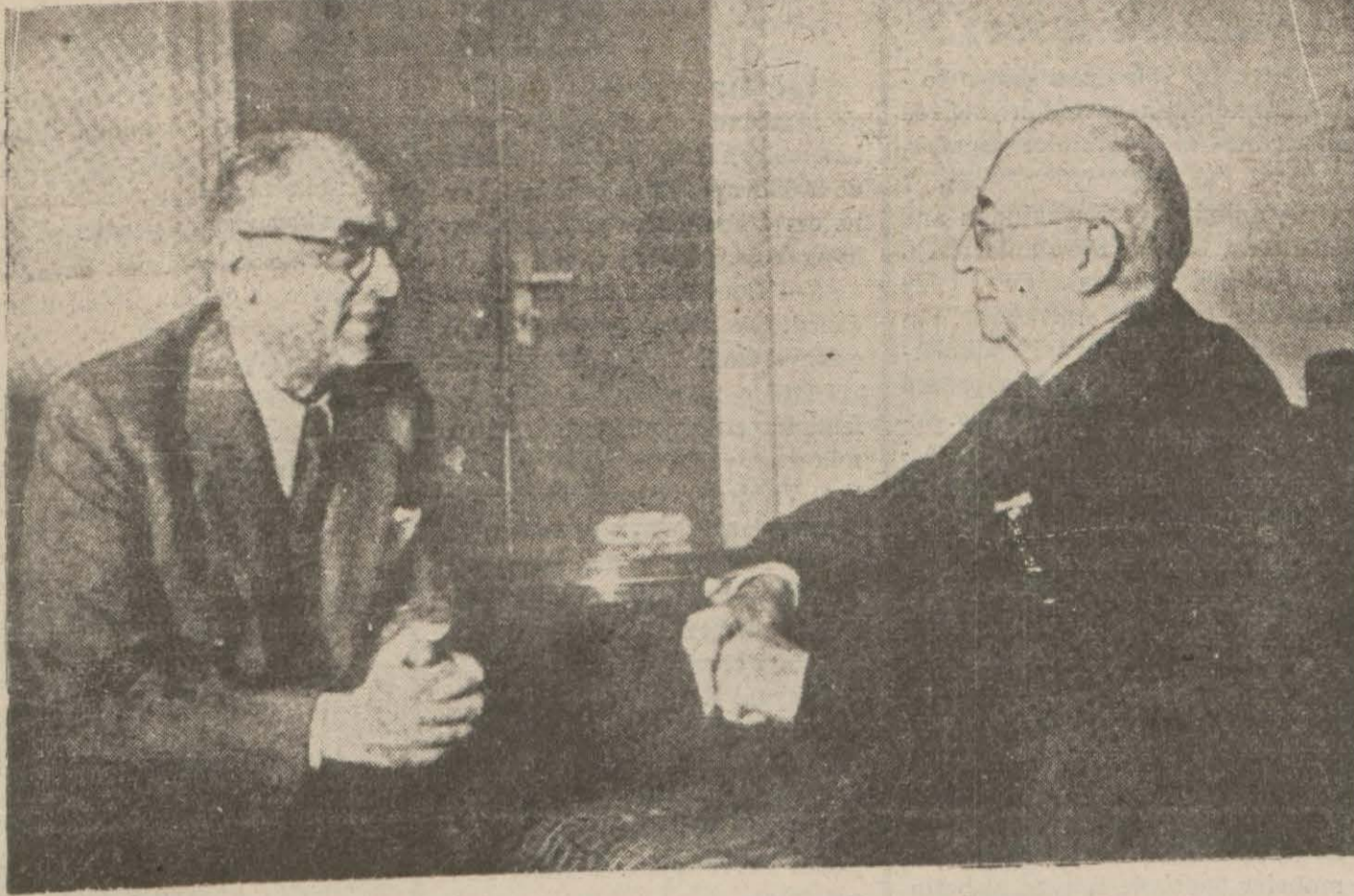
Başvekilimiz Dr. Refik Saydamın evvelki gün Başvekalette Celâl Bayarla birlikte alınan resmi

Hüseyin Cahid YALÇIN (Sonu 3 üncü sayfada)