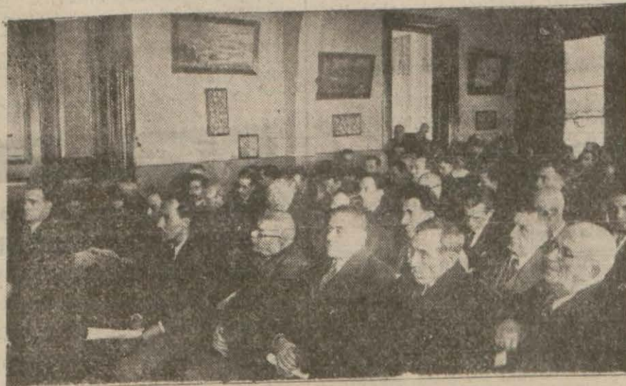
Esnaf cemiyetleri idare heyetleri azalarının Halkevinde dünkü içtimalarından bir intiba (Yazısı 7 de)

Dün Halk Partisinde Toplanan Mümessiller Esnaf İçin Faydalı Kararlar verdiler