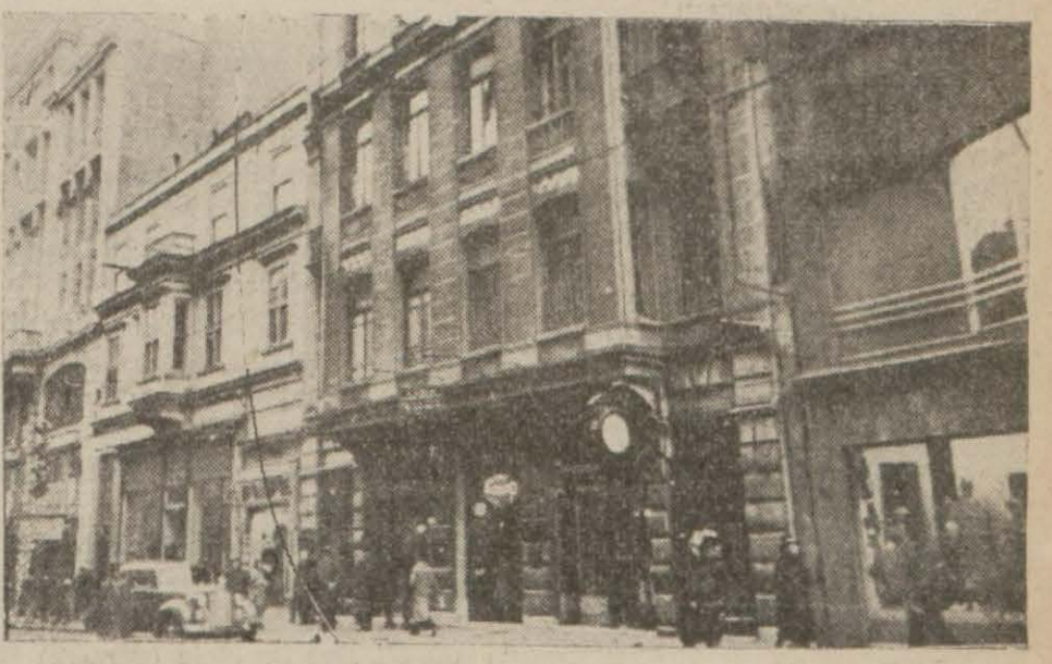
İstiklâl caddesinde Banka hanında İmpeks şirketinin merkezi (Saatin üzerindeki 2 nci odadır)

Tahkikat ve Takibat Ehemmiyetle Devam Ediyor