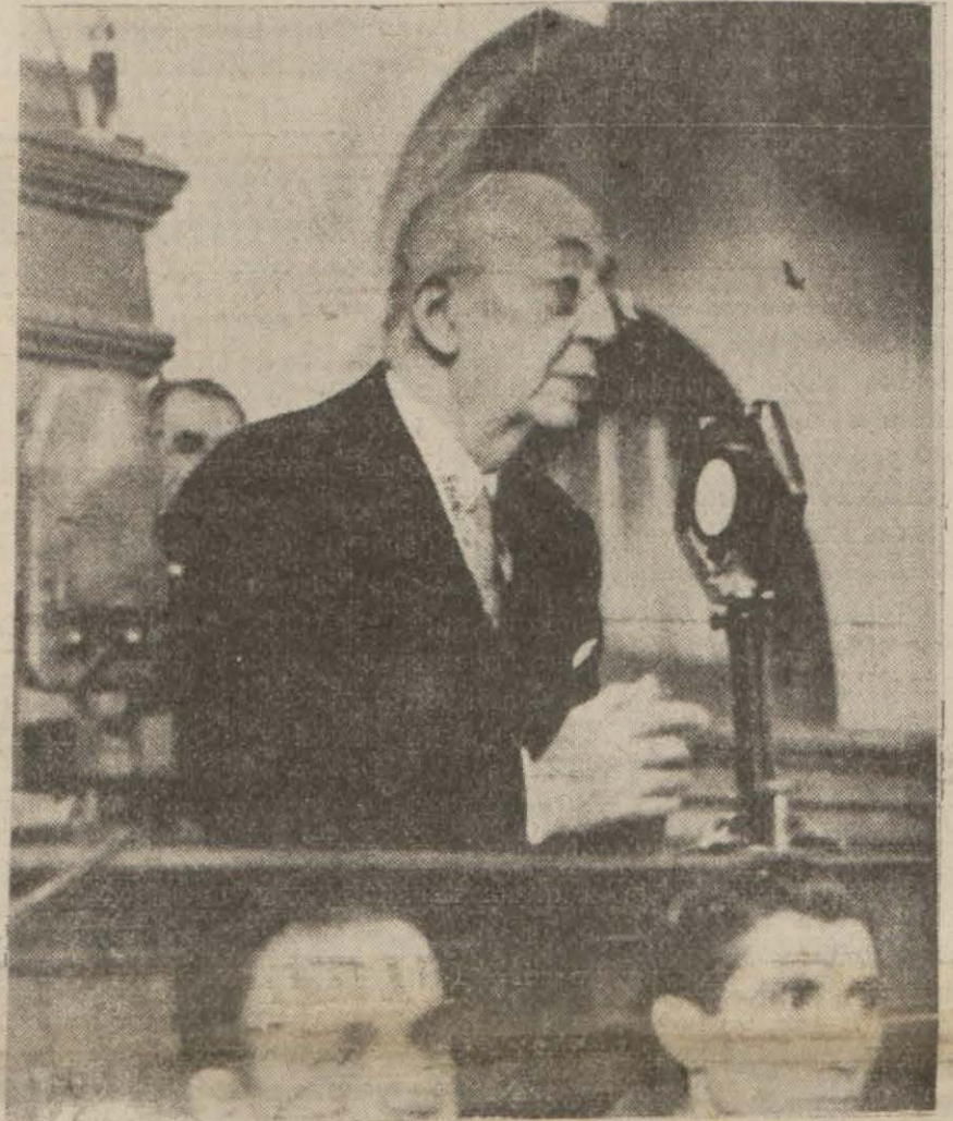
Yeni Başvekilimiz Dr. Refik Saydam B. M. M. Kürsüsünde

Biz ötedenberi işlerimizi sükûn Hüseyin Cahid YALÇIN (Sonu 3 üncü sayfada)