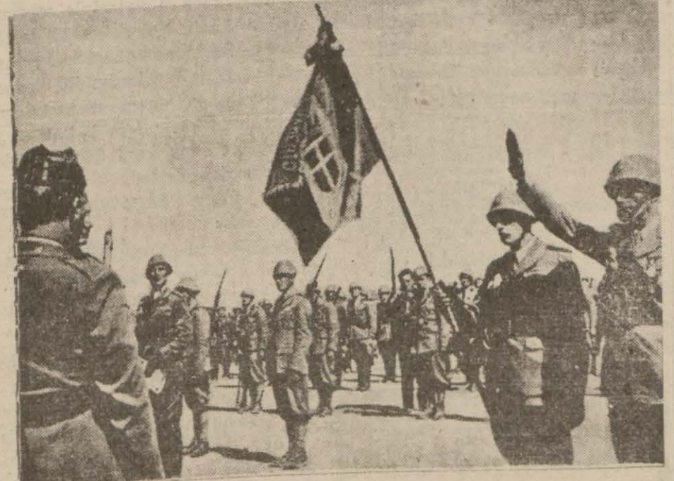
General Franco İspanyada harbeden İtalyan gönüllülerini selâmlıyor

Barselon: 10 (A. A.) — Dün öğleden sonra Sierra llena boyunca ve Borjas blancas cenubunda şiddetli muharebeler olmuştur. Artesa de segri mintakası da bütün şiddetli muharebelere sahne olmuştur. Cumhuriyetçiler, Anudane mukavemet etmişlerdir. Günün sonunda mahsus surette aynı mevzileri ellerinde tutmakta idiler. Frankistlerin Katalonyada girişmiş oldukları taarruzun ikinci haftasının bilâncosu şudur: Borjas blancas ve Artesa de seg (Sonu 3 üncü sayfada)