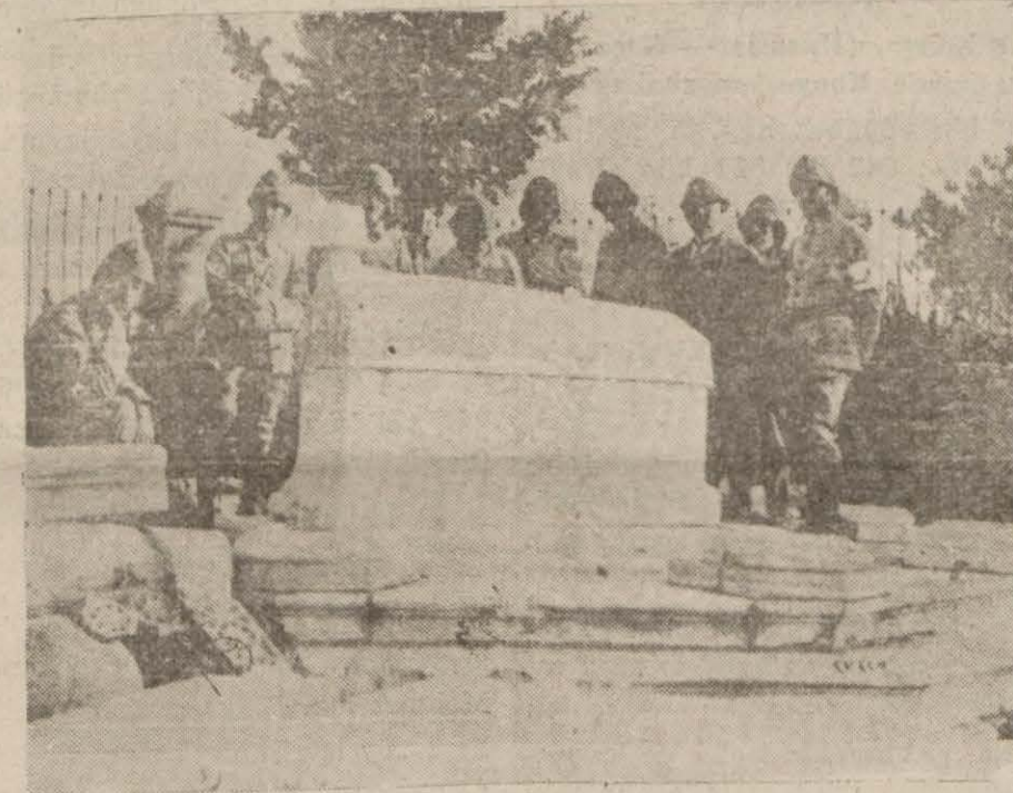
Heyeti edebiye Gelibo,uda düşman mermilerine hedef olan büyük şairimiz Namık Kemal'in makberini ziyaret ederken

3) Maskeli teşkilât: Bu teşkilât mensubları; kılık kıyafet, din, dil... gibi kültüre müteallik vasıflar itibarile içinde buldukları haktanmış gibi görünürler ve gayelerine ermek için halkın hariminde çalışı-