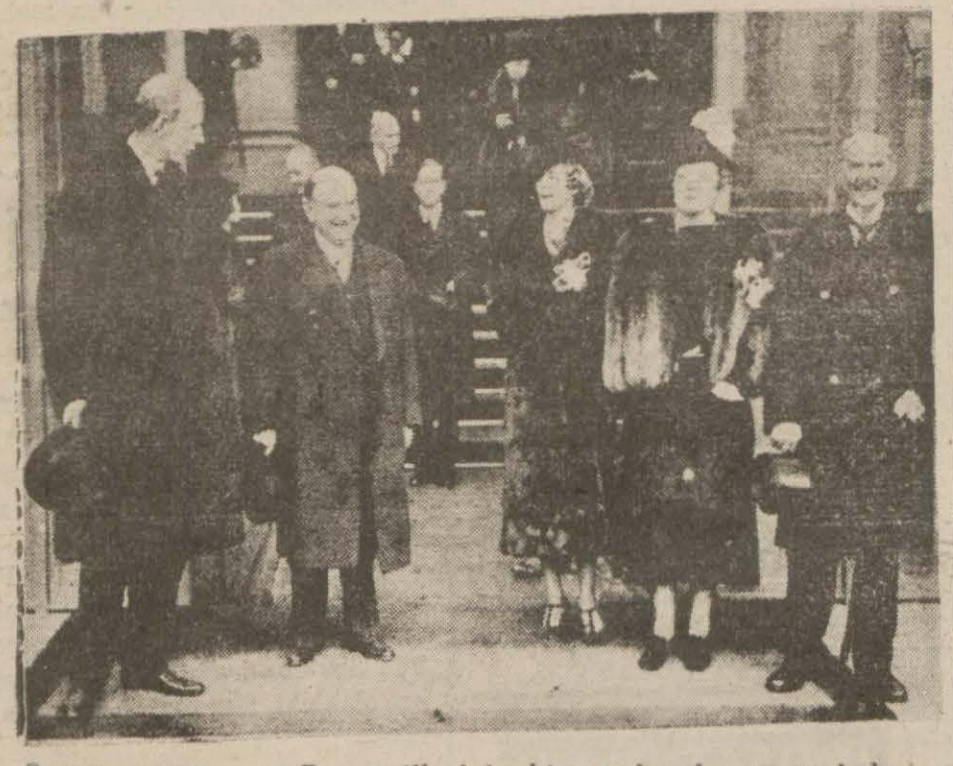
İngiliz ve Fransız Başvekillerinin bir arada alınmış resimleri

Londra: 10 (A. A.) — Başvekili Chamberlain, refakatinde Lord Halifax, müşavirler ve hususî kâtibleri olduğu halde hükümet reisleri arasında şahsî temaslara siyasetine devam etmek üzere Roma seyahatinin birinci merhalesi olan Parise hareket etmiştir. Fransız Gazetelerinin mütaleaları Paris: 10 (A. A.) — Bütün gazeteler, B. Chamberlain'ın Romada Paris ile Roma arasında mutavassatı