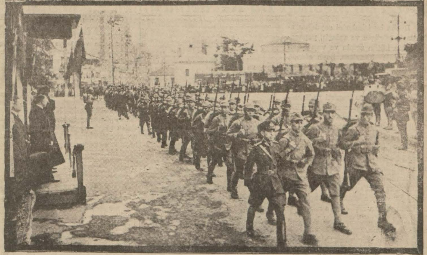
Kahraman askerlerimiz tribünün önünden geçerken

100 Bin Liraya Büyük Bir Beden Terbiyesi Binası Yapılacak Yazısı 3 de