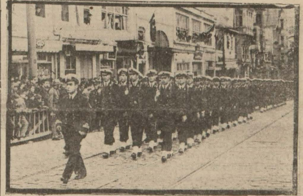
Bahriyelerimiz resmi geçide

Dünkü kariimize cevap veren başka bir okuyucumuzun yazısını bugün 3 üncü sayfamızda okuyunuz.