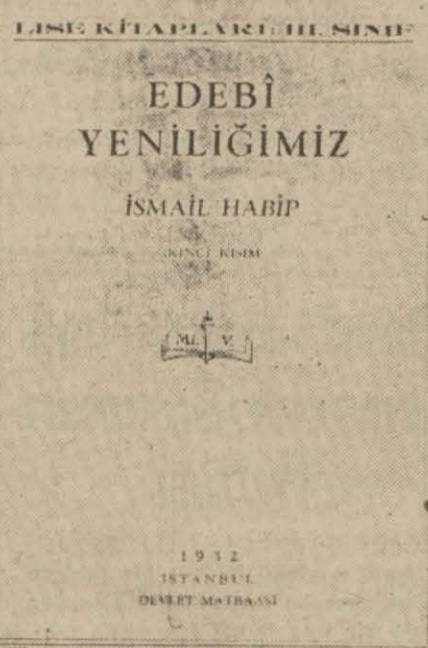
Maarif Vekâletinin bastıracağı Kitaplardan biri