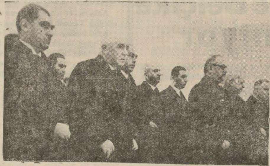
Meclis Reisi ve Vekiller, tazim vakfesinde