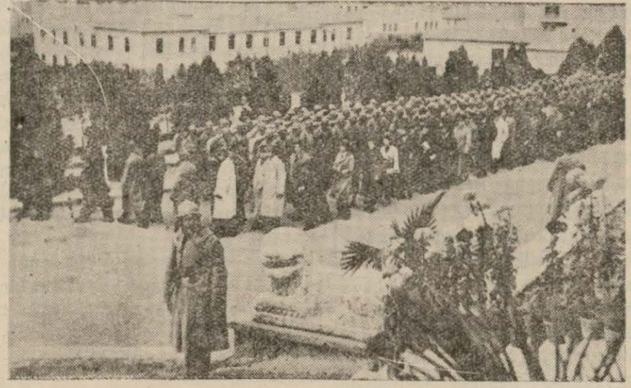
Ölmez Şef'e ödenmez minnetlerini arza giden halk, mitingde akışıyor