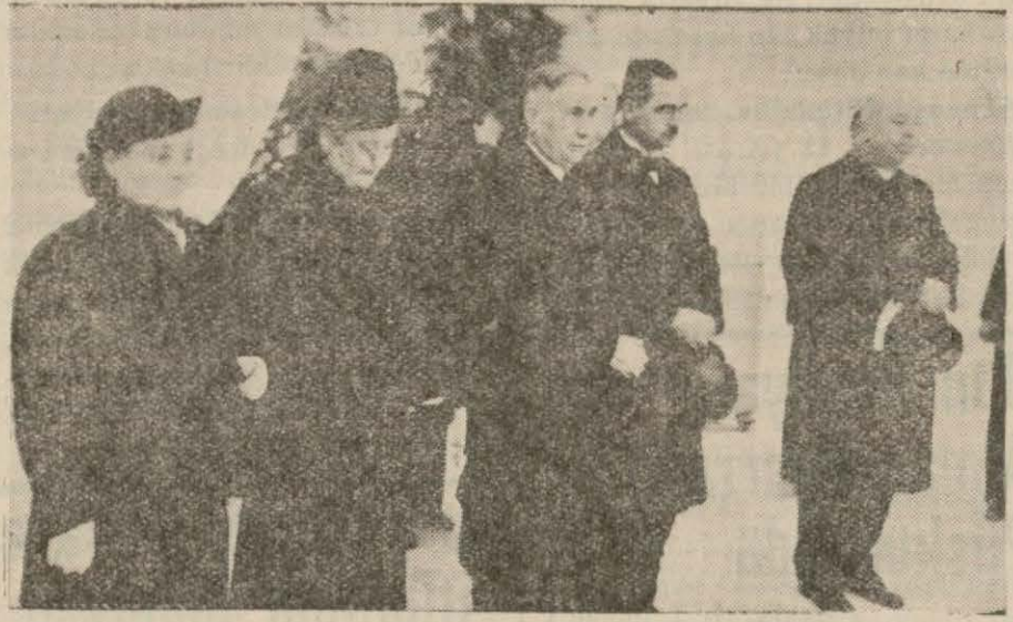
Tarih ve Dil kurumları azatları Ebedî Şef'in manevî huzurunda