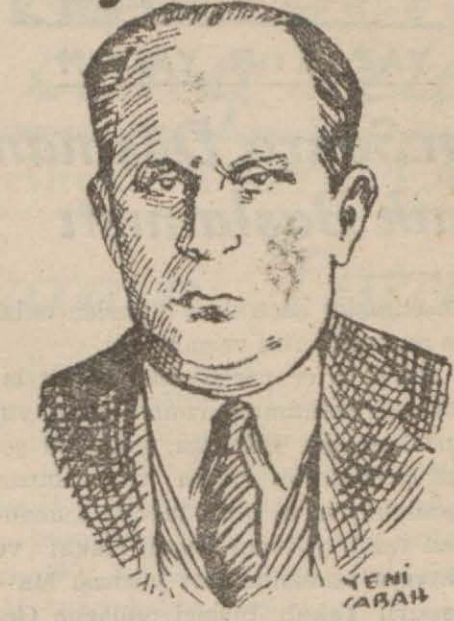
Ticaret Vekili Nazmi Topçuoğlu

Harb istemiyoruz! diye ortaya çıkarak, milliyet prensipleri ve milletlerin kendilerini idare etmeğe hakları olması esası üzerine müstenid bir sulh teklifi yapmaktır.