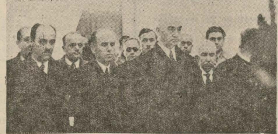
Parti heyeti, Partinin banisine tazim vazifelerini yapıyor