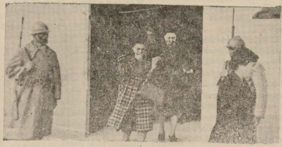
Muvakkat kabir başından huçurarak çıkan Atatürk kızları