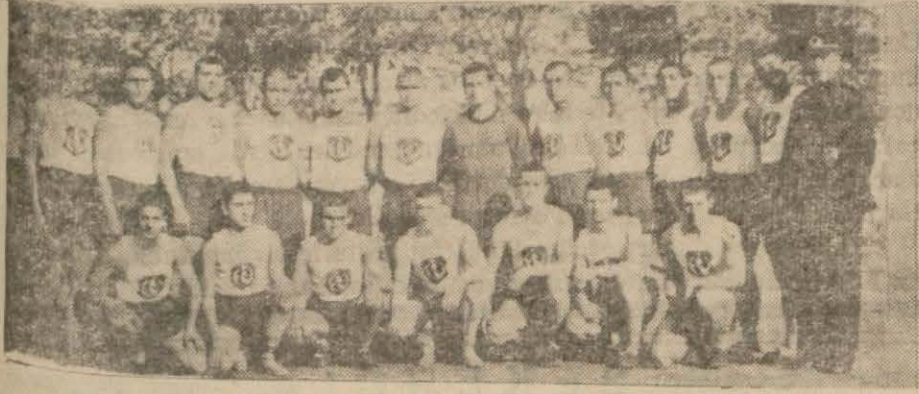
Dünkü atletizm müsabakalarında şampiyonluğu kazanan Kuleli lisesi atletleri öğretmenleri ile...

Dünkü Müsabakalarda Bir Türkiye 4 Askerî Lise Rekoru Kırdı