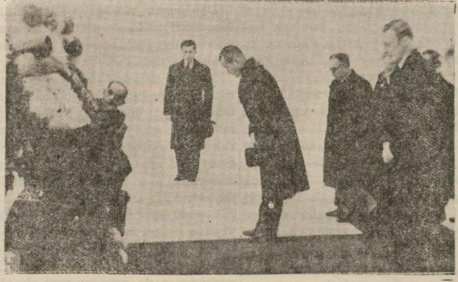
Kordiplomatik namına, Duvayyen Amerika sefiri çelenk koyarak Atanın manevî huzurunda eğiliyor.