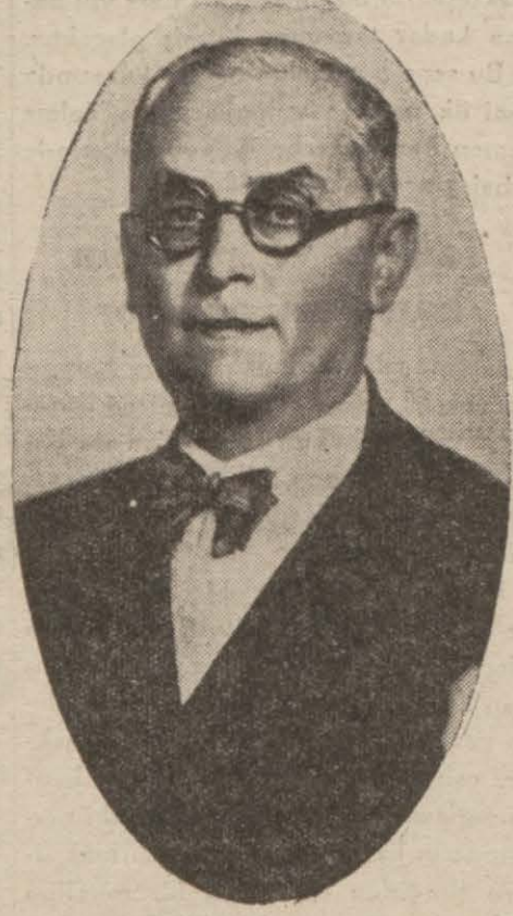
Parti grupunda izahatta bulunan Başvekil Celâl Bayar

Bundan sonra dahiliye vekili ve Parti Genel Sekreteri Şükrü Kaya geçen sene Parti mebuslarının intihap dairelerinde yaptıkları tetkiklere ait raporlardan alınan iyi neticeleri ve bu sene de yaz tatili dolacağı için (Devamı 3 üncü sayfada)