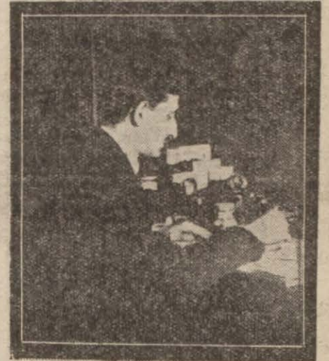
Daha yurda ayak basmadan matbuatı birbirine katan Refik Halit

Meselâ, gene matbuat sahnesi- nin hayretle seyirci olan biz bitaraf