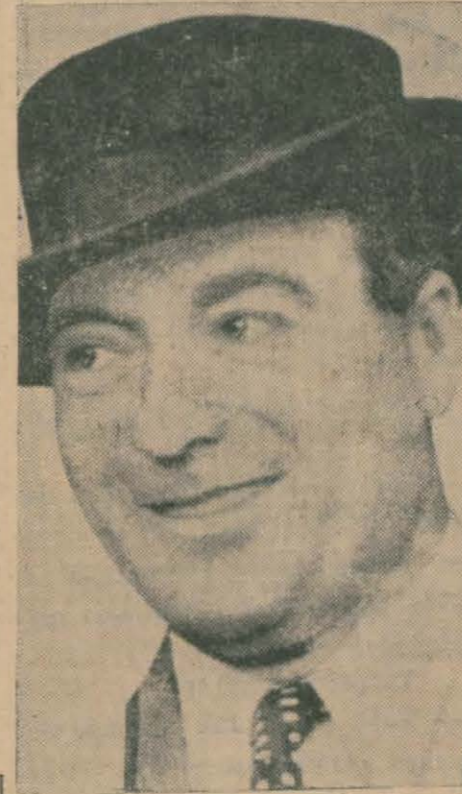
Petrol Kralı Riket