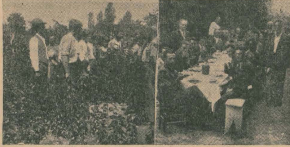
İzmitte bahçıvanlar kursunda bir tatbikat dersi ve yemek

İzmit, 12 (Hususî) Vilâyette zirai hayata, geniş bir kıymet verilmekte - dir. Bilhassa meyvecilik sahasında ya pılan ve başarılı işler hayli çoktur.