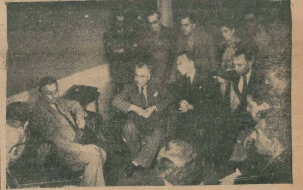
Dahiliye Vekilimiz B. Şükrü Kaya Basın Kurumunda gazetecilerle görüşürken

Dahiliye vekilimiz Şükrü Kaya gazetecilerin derdlerini dinledi