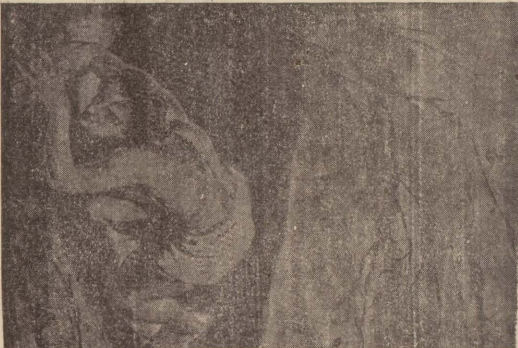
Romanın kurulus masasına göre Romos ile Romos'un bir dişi kurt tarafından beslenmiş ve büyütülmüştür.