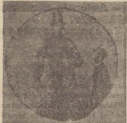
Uç metreye yukarı uzayan Anasikâli dev. Pitüiterisi fazla ifraz ediyor

Diğer bir tecrübeye de, bir haftalık, henüz yavru tüylerini dökmemiş piliçlere horoz gibi ibik büyüttürmek, ötmelerini temin etmek mümkündür. Yavrularını zerketmekle erkekliklerinin hiç olmazsa harici tezahiratını iade etmek