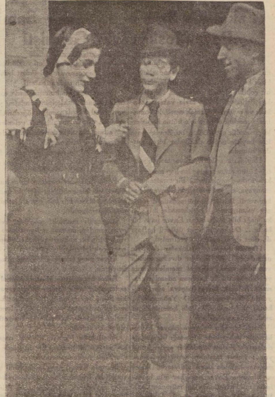
Şehirde böyle gezen çingeneler cadılar da yine kendi purlarına birünürler dolusu para verirler, elektrik yakma-

Çingeneler medeniyetin içine girmişler fakat medeniyeti kendi içlerine sokmamışlardır..