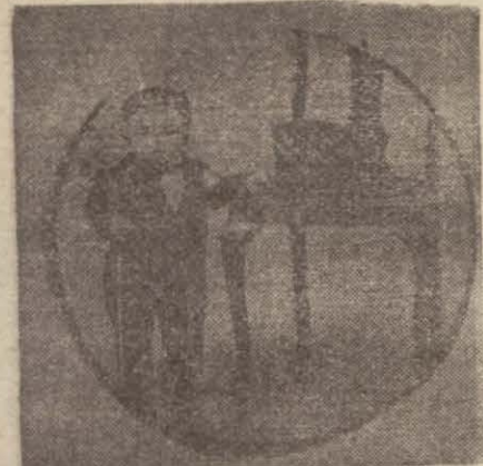
Gayri kâfi Pitüiteri insanı cüce buralır

«Çu metre boyundaki Amerikalı devin «Pitüiteri» si de lüzumundan fazla ifraz etmiş. Sonra, sakallı bıyıklı kadınlar, öni alınması şüphanlık, felâkete sürükliyen zayıflık başına gene böyle «Hormon» ifrazatı ile izah edilebilir.