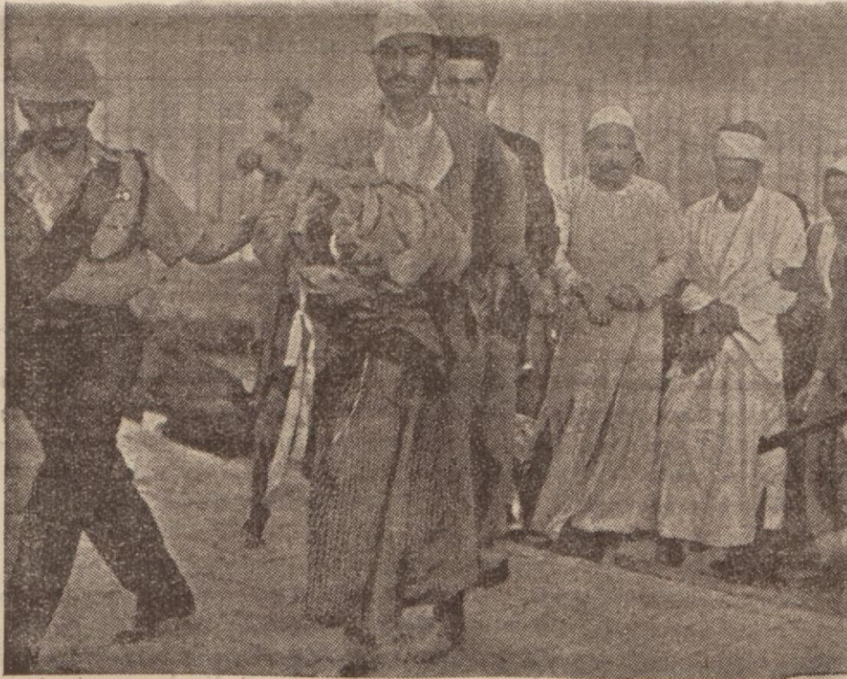
Arap, tedhişçiler İngiliz askerleri arasında.