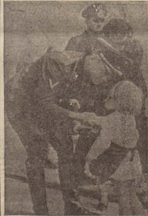
Alman hariciye nazırı B. Ribbentrop Alman askerleri

İyi komşuluk münasebetlerinin kurulması için Çekoslovak hapishanelerindeki mevküfların serbesti lâzımdır