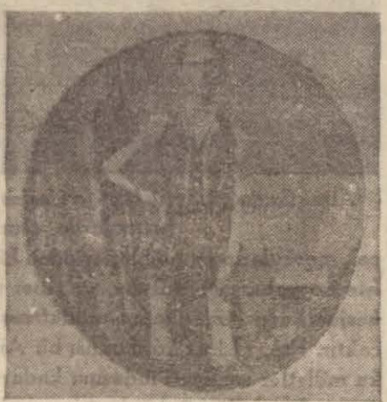
İntâç eder CİNSİYETİ YAPAN SEY

Dahili ifrazat guddeleri hakkındaki bu unumî mukaddemeyi, «Hormon» ların en son keşfedilen ve şüphesiz en fazla alâka uyandıranını daha kolay izah edelim.