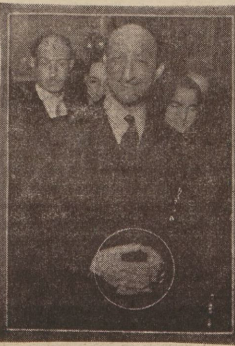
Fransa hariciye nazırı Bonne

Ankara, 15 (Hususi) — Çinde hüküm süren kolera hastalığı dolayısıyla Çin hükümeti Çine kolera aşısı gönderilmesini hükümetimizden rica etmişti. Sıhhat ve içtimâl muavenet vekâleti tarafından hıfzıssıhha müessesesinde hazırlanarak Çine gönderilen kolera aşısının miktarı bir milyon santimetre mikâbına varmıştır.