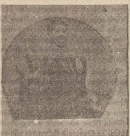
Gayri kâfi Thyroid hormonunun doğurduğu netice

mümkün olmalı... Şeker hastasını hayvanların Pankreasından alınan Ensülinin zerkedildiği gibi. Evet bu tecrübeye, Haremâğasının ihtiyarlamış ve dejener olmaması şartıyla tamamen mümkindir.