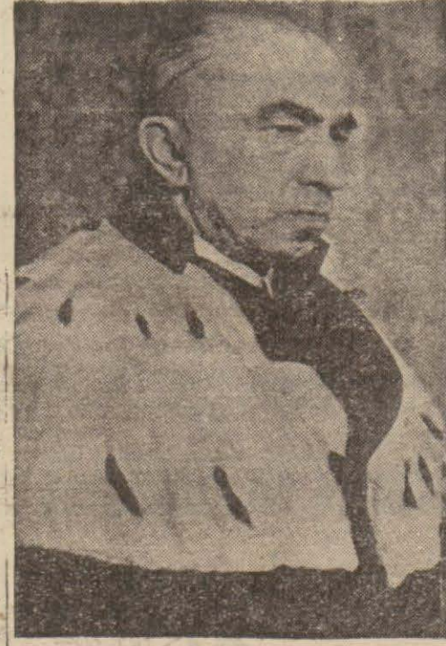
Çekoslovakyanın yeni Cümhurreisi

Pragdan alınan ve «Izvestiya» da nesrolunan habere göre Almanya, Karpatlaraltı Ukranyasının Rutenya başşehri