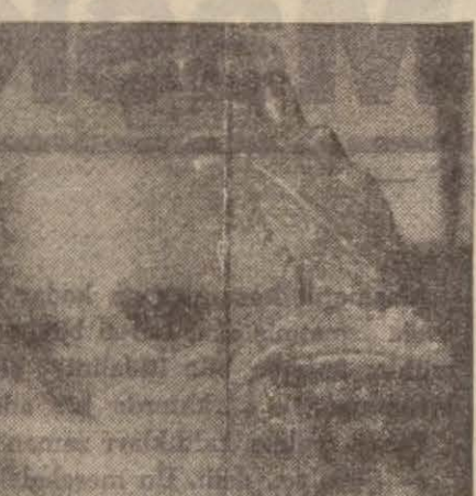
Adrenalin hormonu fazla sakallı kadın kâl ve ahvalden hiç birini göstermeden büyür gider. (2) numaralı resimdeki soldaki kalıya bakınız, horozdan ziyade bir tavuğa benzemiyor mu? Şimdi, aynı şekilde hadım edilen diğer bir horoza erkeklik «Hormon» u zerkediniz, kısa zamanda, hayvanın sağdaki şekli aldığını göreceksiniz. Bu noktada daima varit olan bir sual vardır: «Acaba Hormon guddelerini aldığımız dişi bir mahlûka erkeklik hormonu zerketsek ne olur? Ne olacak, tavuk horoz ârazi

bulacağını tasavvur edemeyiz. Roma, 15 (Ö.R) — Gazeteler Çemberlayn'ın nutkundan İtalyan - İngiliz mü-nasebetlerini alâkadar eden kısımları dercetmekle iktifa etmektedir. Diğer parça-