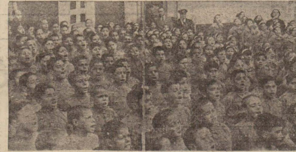
Tunusta faşist İtalyan çocukları

Bu diyarın İtalyanlar üzerinde bıraktığı sihri tesir Sicilya adasının garp sahillerinde, Marmalada bilhassa kendini gösterir. Çünkü Tunus sahilinin güzel kordonunun ufukla karışmış hatlarını buradan görmek değilse bile sezmek kabildir. Tunusla İtalyayı bu bakımdan ayıran deniz Manş denizinden daha geniş değildir. Tarih okuyanlar bilirler ki bundan iki bin üç yüz yıl önce Romanın en büyük düşmanı Kartacalılar Afrikanın bu sahilinde yerleşmişlerdi. Kartacalılar Sicilyayı işgal etmek için aradaki dar denizden geçiyor-