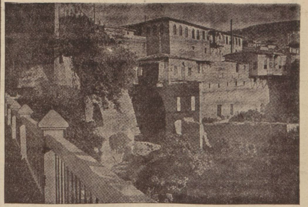
Antakya'dan bir görünüş

Paris, 15 (Ö.R) — İskenderundan alman haberlere göre İskenderunda serbest liman mmtakasında yeni bir liman inşası için tetkik için bay Asımın riyasetinde teknik bir Türk heyeti İskende-