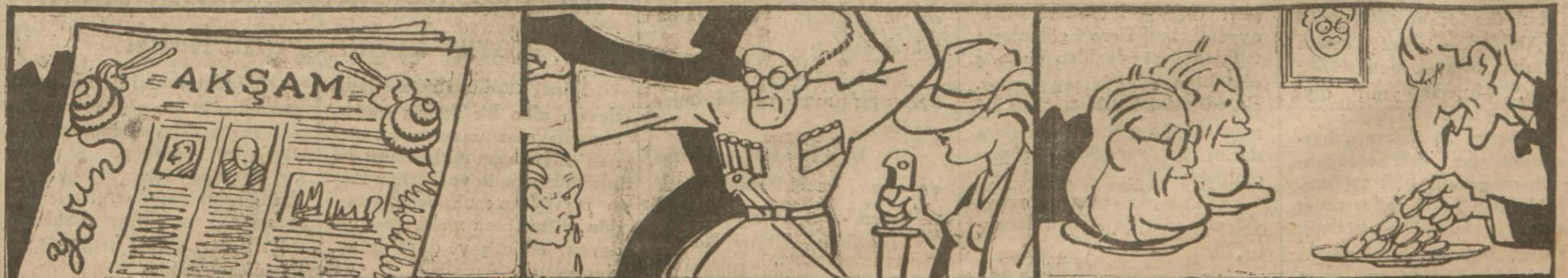
Akşamın iki sütununa dadanan sümüksü böcekler!

Akşamdan akşama neler olur neler! biter?