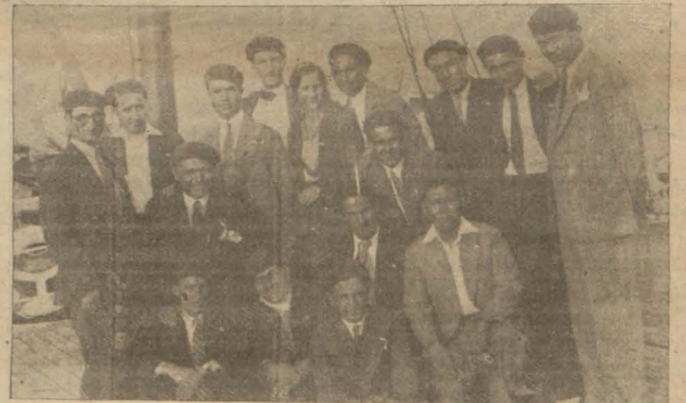
Dün Bulgaristana giden Fen fakültesi talebesi

16 kişilik kafile Sofya Darülfünununa misafir olacak