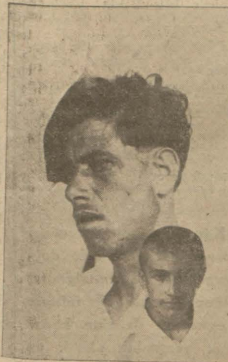
Unkapanındaki cinayette mecrur olanlardan ikisi [Tatili 3 üncü sahifemizde]