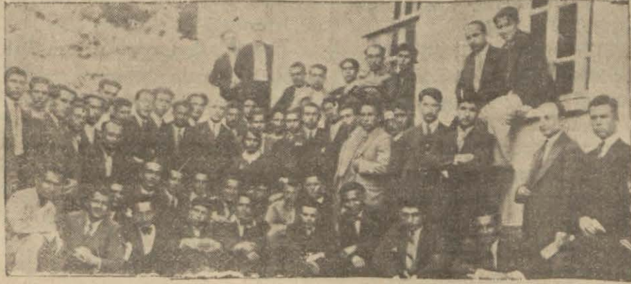
Çil yavrusu gibi dağıtılan yegâne maden mühendis mektebimizin talebesi

Yegâne maden mühendis mektebimiz kapatıldı, talebe dağıtıldı