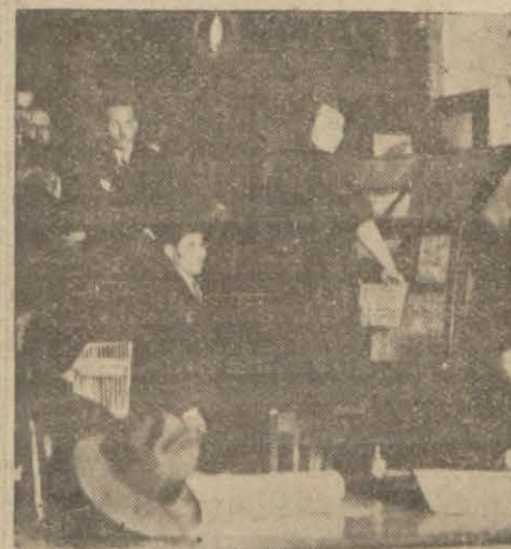
Dün tayyare piyangosu çekkilirken (Kazanan numaraların tam tistesini 4 üncü sahifemizde)