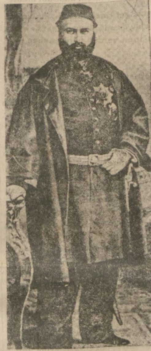
En fazla borç bırakanlardan Sultan Aptülaziz

Sultan Mecidin Nisantaşında on beş gün ve gece fasula verilmeden yapılan «Suru Hümayunu!» için tamam iki yüz elli milyon kuruş sarfedilmişti. Yalnız «Refia» ve «Cemile» sultan-