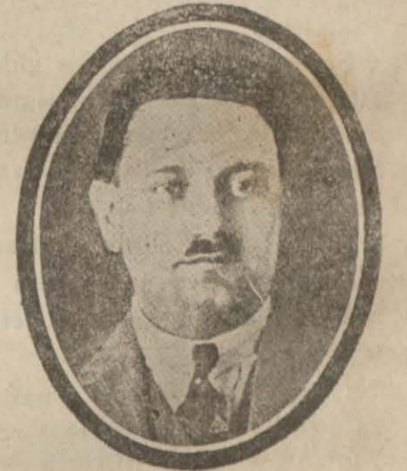
Maarif vekili Cemal Hüsnü B.

Şehremini Muhiddin beyden soruyoruz: Bu memurlar herkesin malını bildikleri gibi satmak ve onüne gelenin tablasını devirmek, dayak atmak cür'etini nerden alıyorlar ve bu çirkin hadiseler nezaman nihayet bulacak!