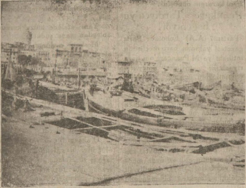
Üzerinde kargaların tünediği liman mavunaları

Hususî eşyalarının masraflarında biz verdik!