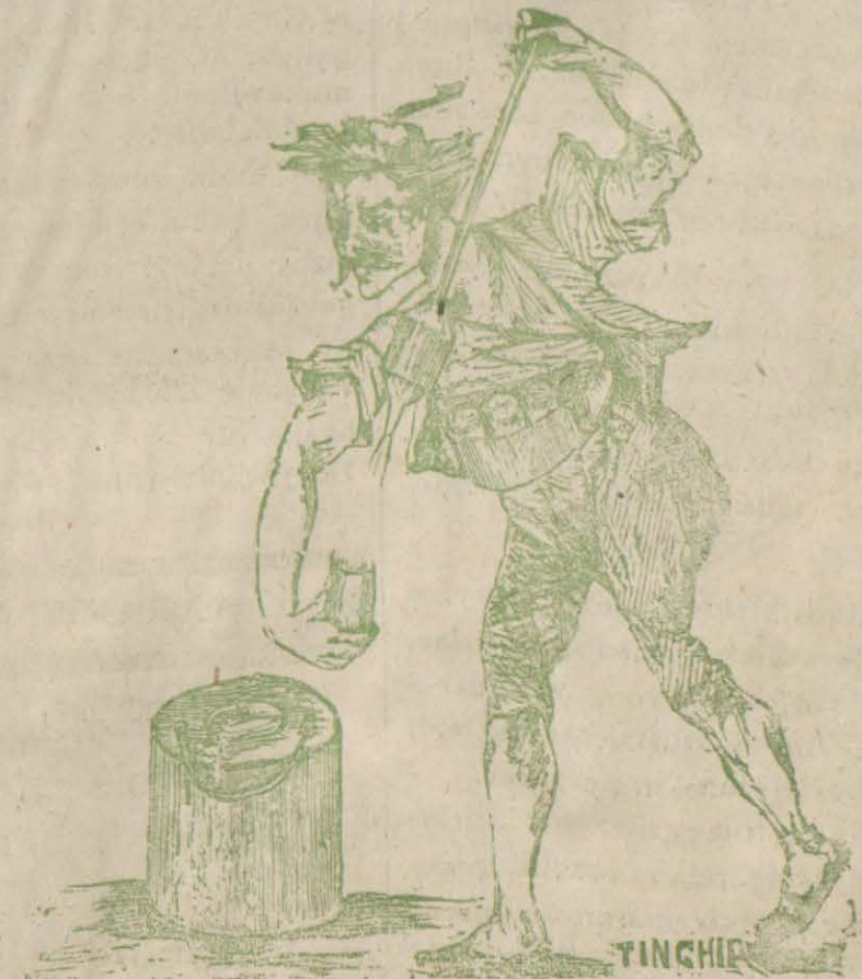
Yarın asr evvel çıkan bir karikatürden. — «Bu da olmasa sıcaktan patlayacağız!»