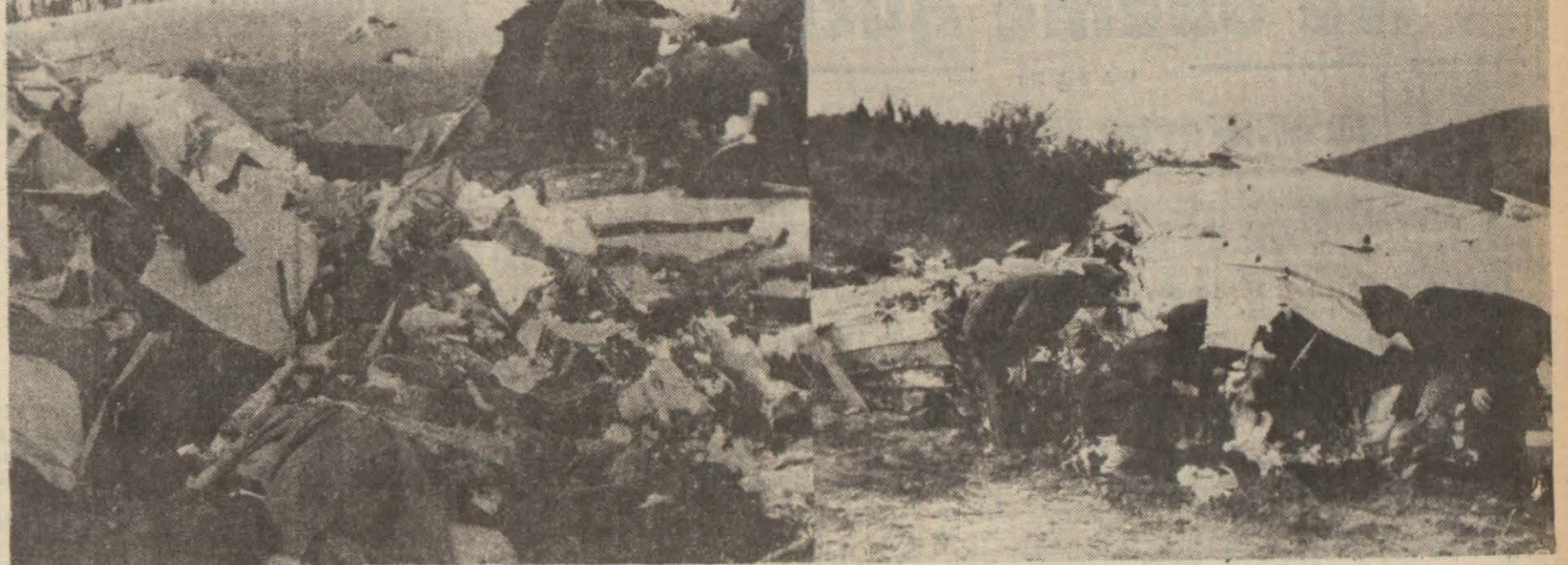
Adana civarında infilâktan sonra param parça olan «Ark» uçağının enkazı ve muayenesi