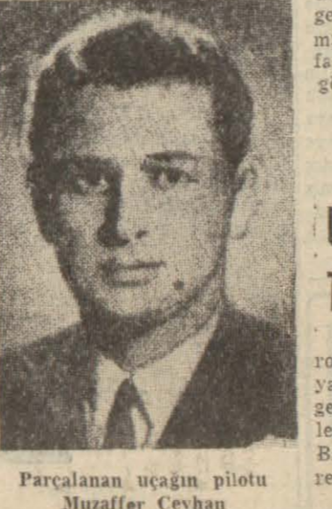
Parçalanan uçağın pilotu Muzaffer Ceyhan

Hususi Muhabirimizden Ankara 4 — Dünkü uçak kazası şehrimizde derin bir teessürle karşılanmıştır. Hükümet erkânı, partiler ve halk da bu faciadan ıstırap duymuştur. Bugün uçağın düştüğü yerde keşif yapılmış, fakat infilâkın sebebi henüz tesbit edilememiştir. Yarın şehrimize nakledilecek cesetlerle birlikte Hava Yolları U-mum Müdürü Ruza Çerçel de dönmüş olacaktır.