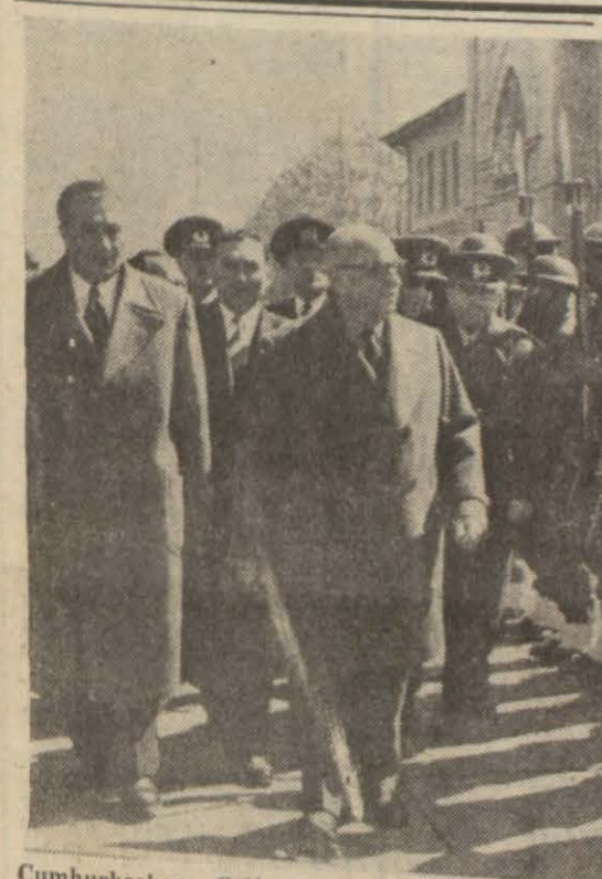
Cumhurbaşkanı Celâl Bayar, Samsun'a giderken Kayseri'de ih tiram kit'asını tefiş ediyor

diğer âmillere bu âni sademe de katılmış, kanadın bir parçası kopmuş, uçak muvazenesi kaybetmiş, bir taraftan da yangın ana deponu sararak havada infilâk olmuştur.