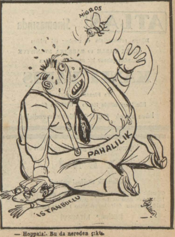
— Hoppala!.. Bu da nereden çıktı..

Anadolu Ajansı Kahire, 4 — Mısır kaynaklarından bildirildiğine göre Mısır topraklarına giren otuz kadar İsrailden mürekkep grup bir Mısır askerini öldürmüşler, diğer birini yaralamışlar ve dört Mısır askerini de alıp götürmüşlerdir. Aynı kaynaktan tasrih edildiğine göre hudut hattını takriben bir kilometre geçen bu İsrail grupu bir Mısır müfrezesiyle karşılaşmış ve müfrezeye ateş etmeye başlamıştır. Bu çarpışmada İsraililerin bir kayıp verip vermedikleri henüz bilin-