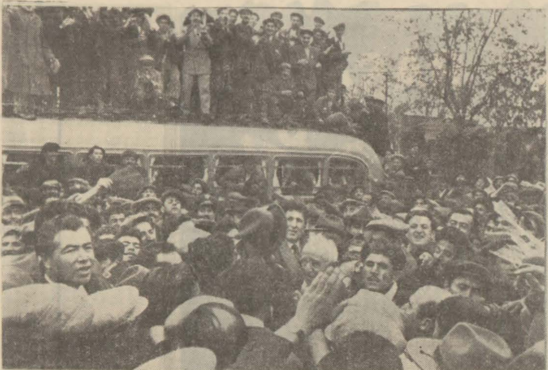
İsmet İnönü Malatya'da kendisini karşılayanlar arasından geçerken

Adana'da parti toplantısı yapıldı. Adana'da parti üyeleri, Kozan'da C.H.P. üyeleri toplanarak konuşmalar