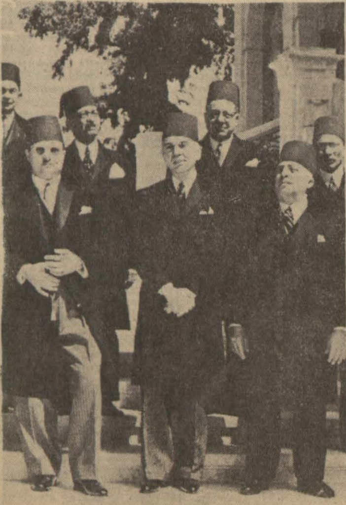
Mısırın yeni Başbakanı Hüseyin Sırrı Paşa (Sağdan birinci) bir toplantıda Kral Faruk ile

Daha ziyade maddî bir manâ taşıyan umumî kalkınma gayretleri içinde fikrî alâkalar hiç şüphe yok ki ihmale uğrayor. Fakat dikkatle bakılırsa şu nokta gözle çarpıyor: Ancak tek parti bas-kası altında muhafaza edilen ve geniş halk kütelerine tamamiyle mal olmayan bir takım inkilâp ve terakkî kıymetlerine karşı menfi ruhlu ayaklanma istidatları durmuyor. Viedan hüriyyetinin terakkî namına öçsüz bir (Devamı Sa: 5; Sü: 5 de)