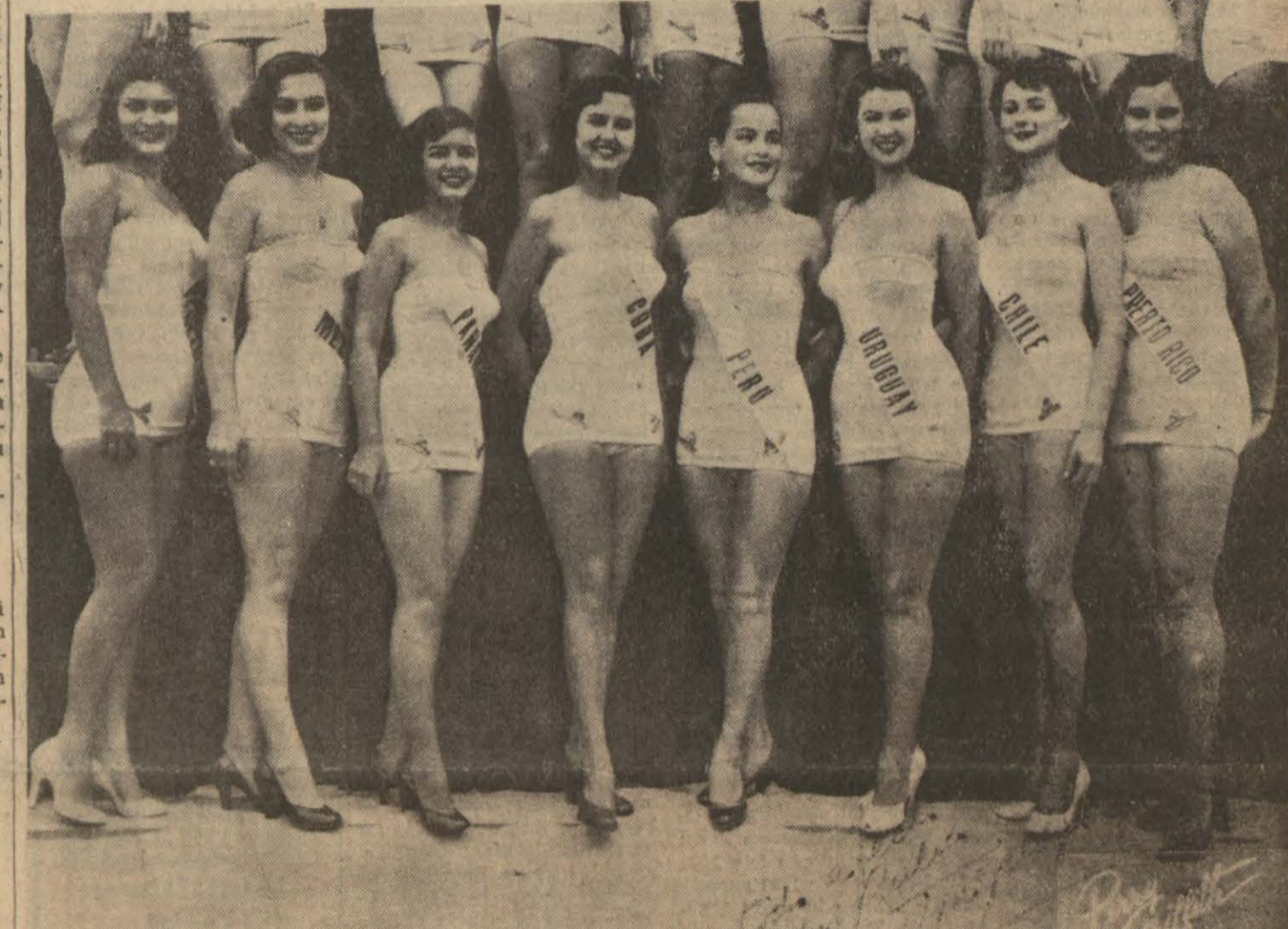
Dünya Güzellik Müsabakasına katılan Güney Amerika milletlerinin güzelleri bir arada (sağdan sola doğru Porto Riko, Şili, Uruguay, Peru, Küba, Panama, Meksika ve Venezuela güzelleri)

Bu hususta hükümet tarafından bir resmî tebliğ neşredilecektir.