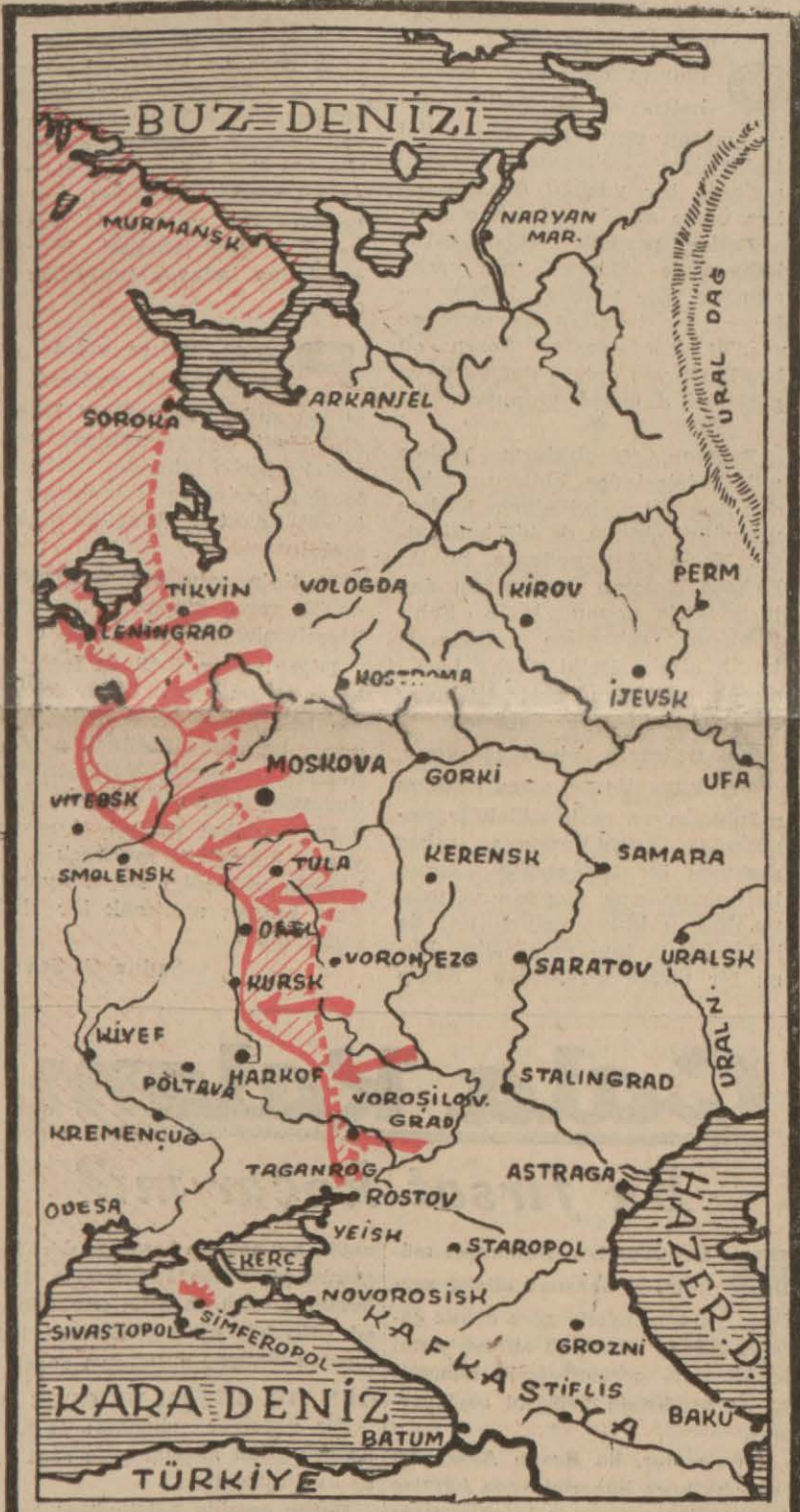
Bütün cephe boyunca Ruslar ilerliyorlar. Haritada, dün Ruslar tarafından İmen gölünün cenebudunda kuşatıldığı bildirilen 16 ncı Alman ordusunun mevkiile, şimdiye kadar Rusların geri aldıkları yerleri görüyorsunuz.

Mareşal Keitel Presburg'da Presburg, 25 (A.A.) — Mareşal Keitel'in Presburg'dan hareketi münasebetle Slovak gazeteleri, samimî yazılar neşretmektedir. Gazetelerin belirttiklerine göre, Alman Mareşalinin ziyareti, Slovak milletinin büyük Almanyanın yanbaşımda zaferi elde etmek için elinden geleni yapmak azmini fazlaştırmıştır.