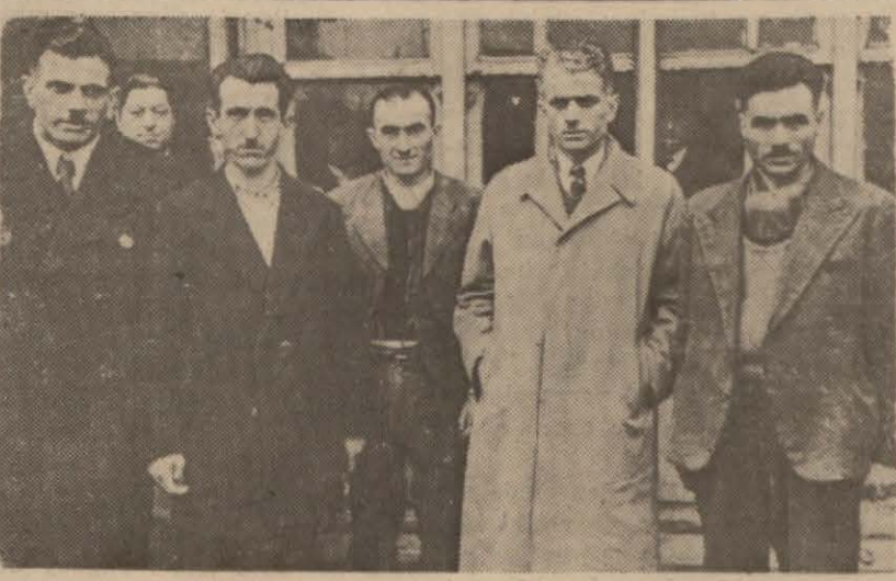
Karadenizde meçhul bir denizaltı tarafından batırılan Çankaya motörünün kurtulan kaptan ve tayfalar. Soldaki motörün sahibidir.

12 saatlik duruşma sonunda suçlu sanılanlar tahliye edildi Duruşmaya bugün ağır cezada devam olunacak