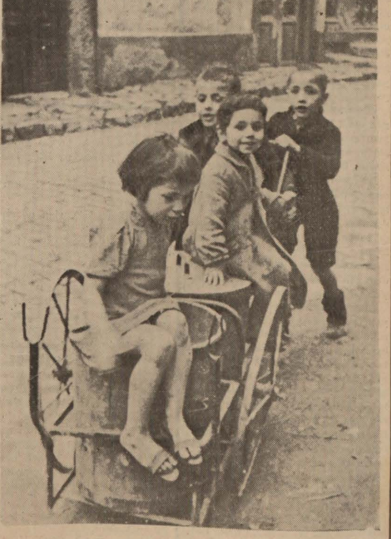
Belediyenin çöp arabaları neye yarıyor, diye düşünmeyiniz? Onlar, sokakların temizliğinde kullanılmaktan ziyade, İstanbulda, oynanacak bahçe bulamayan çocukların oynamasına yarıyor. Resimde çocukları bir sokağın içersinde, hayatlarından memnun eğlenirken görüyorsunuz.