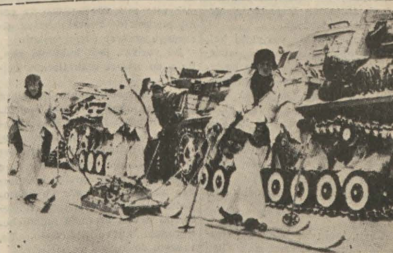
Şark cephesinde karlar erimeğe başladı. Fakat henüz bir çok yerde kar kalmış değildir. Tanklar henüz şiddetle saldıramıyor

Bu hususta adli makamlarda yaptığımız tahkikat, yukarıda bildirdiğimiz kanunî mevzuatı (Devamı Sa: 3 Sü: 2 de) =