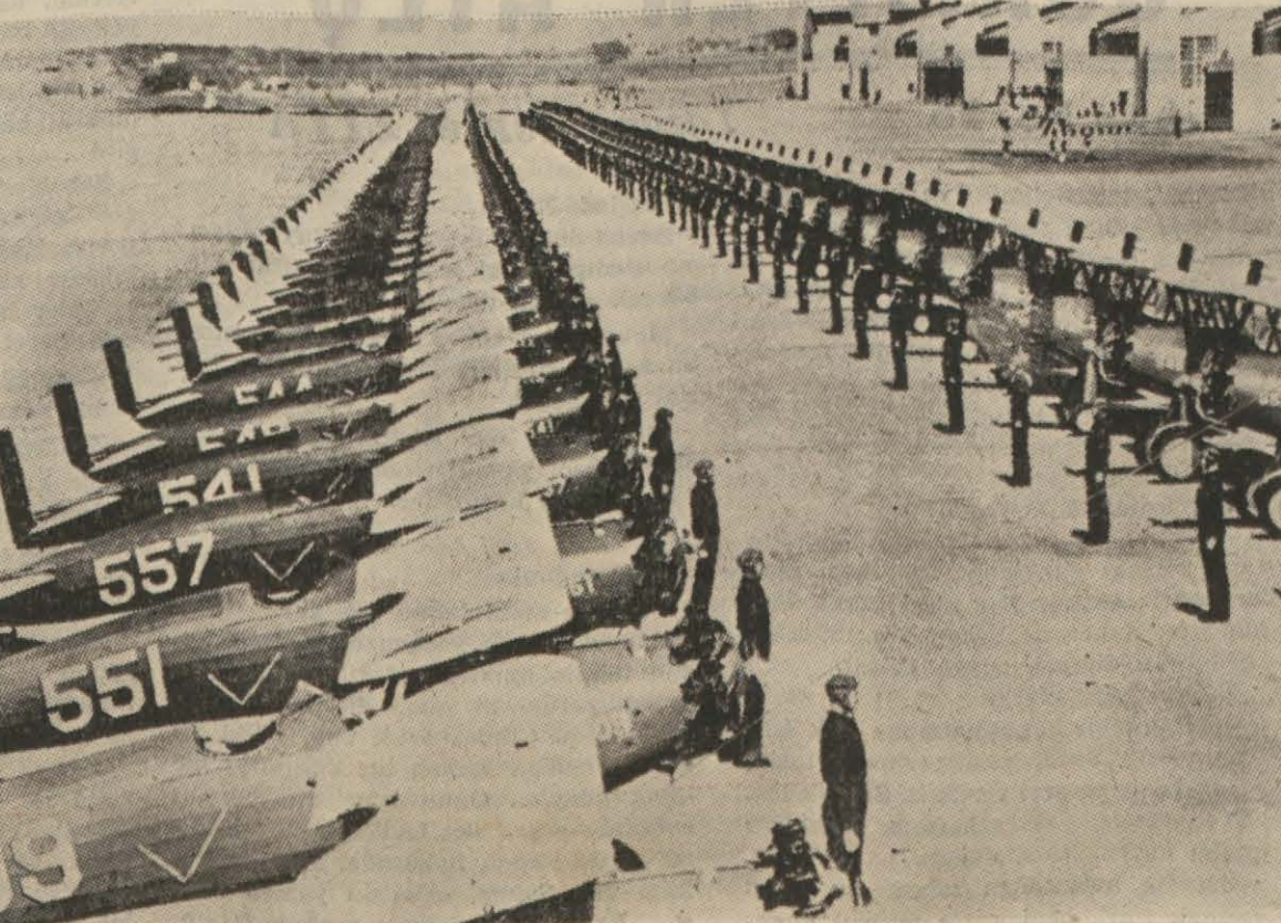
Uzaksarkta büyük bir faaliyet gösteren Amerikalı pilotlar uçuşa hazır bir vaziyette

Hint milletinin günün birinde bir anlaşmağa varması hususundaki ümidimi kaybetmedim. Ötünde sonunda bir anlaşma şekline nasıl olsa varılacaktır. Bu Hintlilerin kendi lehindedir. Biz mümkün olan teklifi yap-tık. Artık yapılacak hiçbir teklif yoktur. Geçmişî mlnakaşa etmek bir işe yaramaz. Kongrenin tasarladığı şekilde bir millî hükümet hiçbir işe yaramaz. Kongrenin tasarladığı şekliyle (Devamı Sa: 3, Sü: 3 de) X