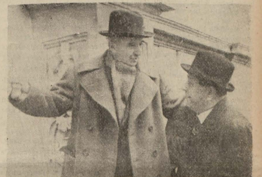
İnönü kendisini karşılayanlara iltifat ediyor

İstanbulular Millî Şeflerini aralarında görmekten mütevellit büyük bir sevinç içindedirler.