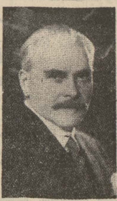
Macar başvekil Kallay

Meseleyi Türk milletinin seçiyiş bakımından tahli etmek lâzım gelirse üzerinde durulacak nokta, tehcirin tatbik şekli değildir, memleketin birçok yerlerinde mahallî hükümetlerin ve halkın oralarda tehcire ihtiyac olmasına karar veremeleri ve bu kararın mes'ulüdür. (Devamı: Sa. 3; Sü. 3 de)XX