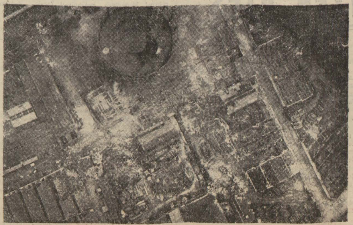
İngilizler geçen bombardmanlarından birinde bir fabrikayı bu hale getirmişlerdi. Şimdi ayda 30 bin uçakla hücum edeceklerine göre harap olmuş fabrikalar çoğalacak demektir. Herhalde yakında İngilizlerin Amerikalılarla müsterek şiddetli hava hücumları yapacakları anlaşılmaktadır.

Pearle Harbour, 8 (A.A.) — Amiral Nimitz tarafından nesredilen tebliğde şöyle denilmektedir: «Düşman, görünüşe göre çekilmektedir. Dün gece düşmanla temas kesilmiştir. Yeniden iki düşman kruvazörü hasara uğratılmıştır. Alınan bütün haberlerin sıhhati tahkik edilmeye kadar bu hatı (Devamı: Sa. 3; Sü. 4 de) %