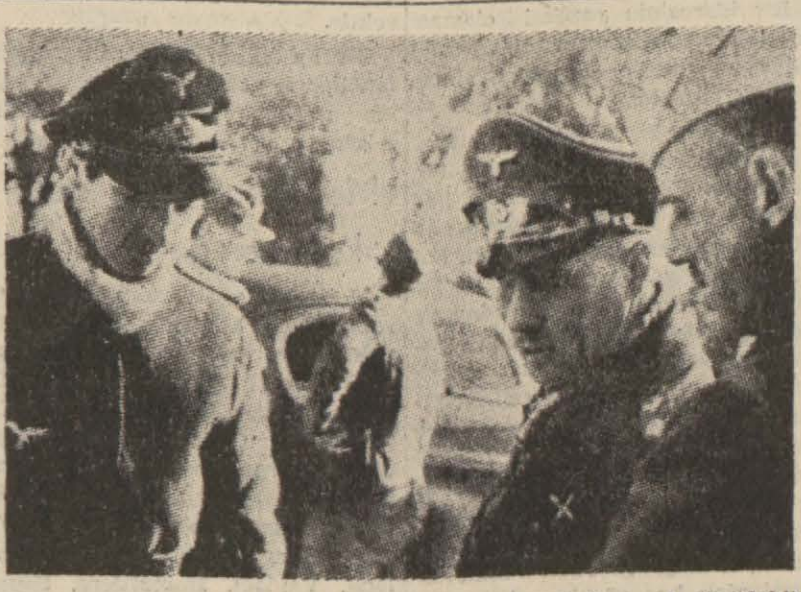
Libyadaki Mihver taarruzunu idare eden General Rommel (Sağdaki) esnasında

Ankara, 8 (A.A.) — Türk Hava Kurumunun sekizinci kurultayı bugün öğleden önce ikinci umumî toplantısını Seyhan mebusu Şükrü Koçak, Millî Şef İnönü'nün başkanlığında yapmıştır. Celsenin açılışını müteakip geçen toplantıya ait zabıt hulasası okunmuş ve Kurum Başkanı Şükrü Koçak, Millî Şef İnönü'nün başkanlığında yapmıştır. (Devamı Sa. 3 Sü. 5 te) (X)