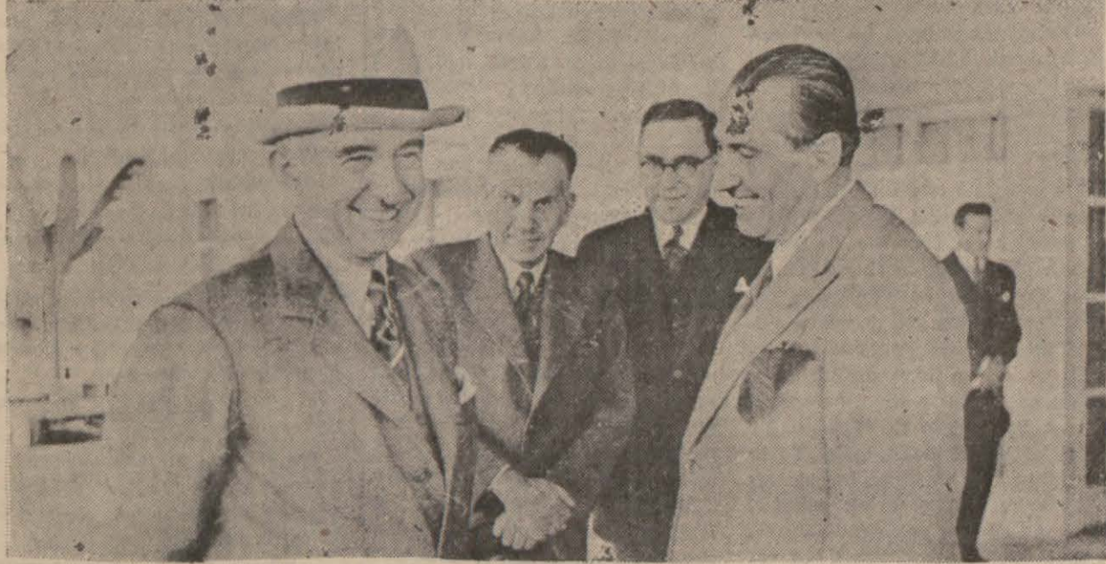
Reisicümhurumuz Millî Şef İnönü at yarışlarının bir gününde...