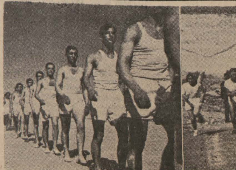
Dün İstanbulda bir tarafta Modada yüzme teşvik müsabakaları yapılırken Şeref stadında da Beşiktaş Halkevinin tertip ettiği atletizm müsabakaları yapıldı ve her iki tarafta da iyi neticeler alındı. Bu müsabakaların tafsilatını üçüncü sayfamızda bulacaksınız.