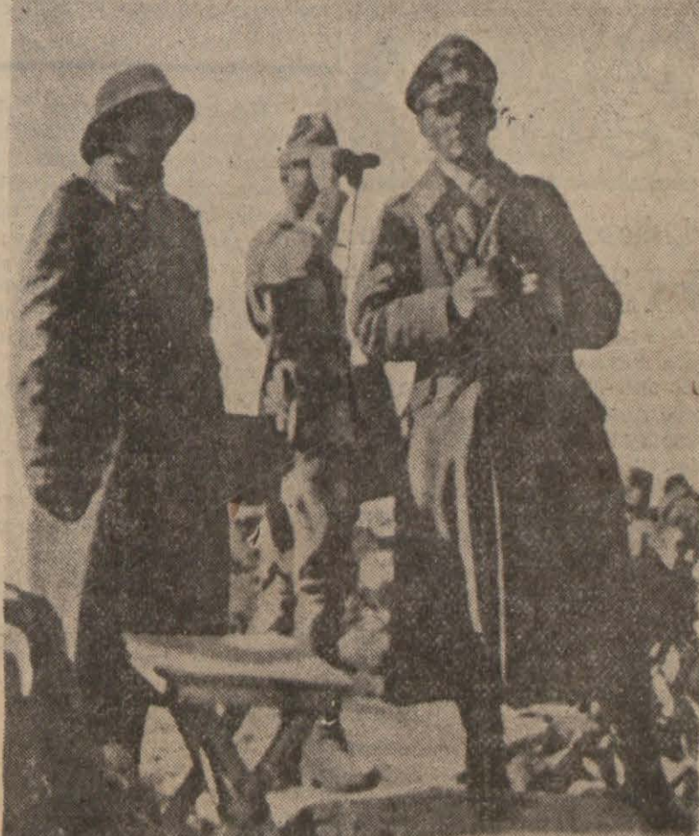
General Rommel Libya'da askerî hareketi takip ediyor

Vaşington, 21 (A.A.) — Of: Dün akşam Çörçilin ikametinin ikinci günü de tamamlandı halde, Beyaz saray harbin güdümü hakkında Ruzvelt ile Çörçil arasında yapılan görüşmeler hakkında hiç bir şey bildirmemiştir. Hükümetin sözcüsü Stephen Early, henüz hiç bir tebliğin düşünülmediğini söylemiştir. Vaşingtonda sandığına göre görüşmelerin konusunu Libya muharebesinden ziyade ikinci cephenin açılması meselesi teşkil etmektedir. (Devamı: Sa. 3, Sü. 4 te) —