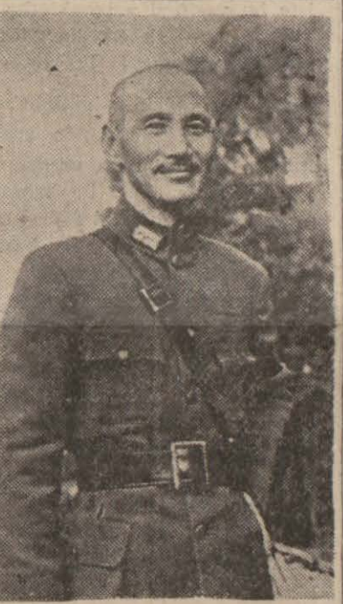
Çağ Kay Sek

Eğobide Almanlar tarafından işgal edildi. Berlin, 1 (A.A.) — Alman ordularının başkomutanlığı tebliği: General Rommel komutasındaki Alman - İtalyan kuvvetleri dün Tobruk müstahkem kalesinin büyük kısmını hücumla zaptetmiş bulunuyorlardı.