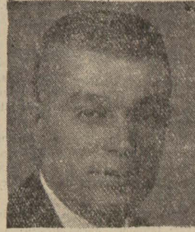
Ticaret Vekili Behçet Uz

Asıl ihtikârı yaratanlar dinlenir ve onlardan fikir sorulur mu?