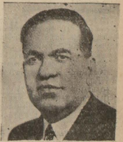
Vali Dr. Lütfi Kırdar

Gıda maddeleri fiyatları her gün hattâ her saat yükselmekte devam ediyor. Fiyat yükselişleri korkunç bir şekli aldı. Tüccarın gözünü kazandı hırsı bürümüş, insaf denen şeyden eser kalmamış ve muhtekir