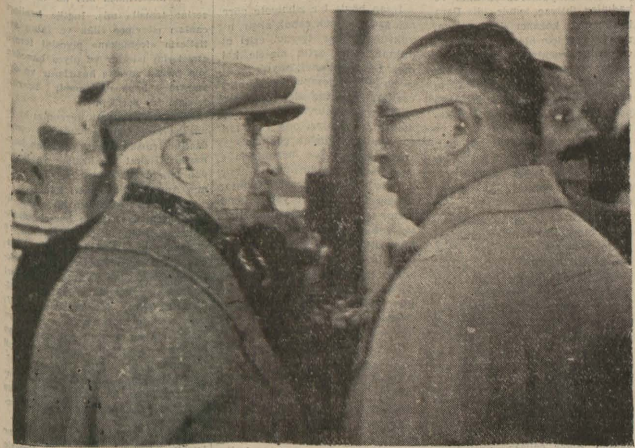
Cümhuriyetimiz İnönü'nün Etimesut tayyare alanına giderek uçurları ve bu arada oğulları Omer İnönü'nün akrobasi hareketlerini takip ettiklerini ve sonra Türk Hava Kurumunun Etimesut atelyelerini gezdiklerini dün yazmıştık. Yukarıdaki resmimiz, Millî Şefi atelyeleri gezirken göstermektedir.