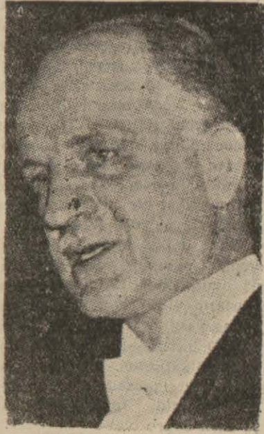
Amerika Hariciye Müsteşarı Sumner Welles