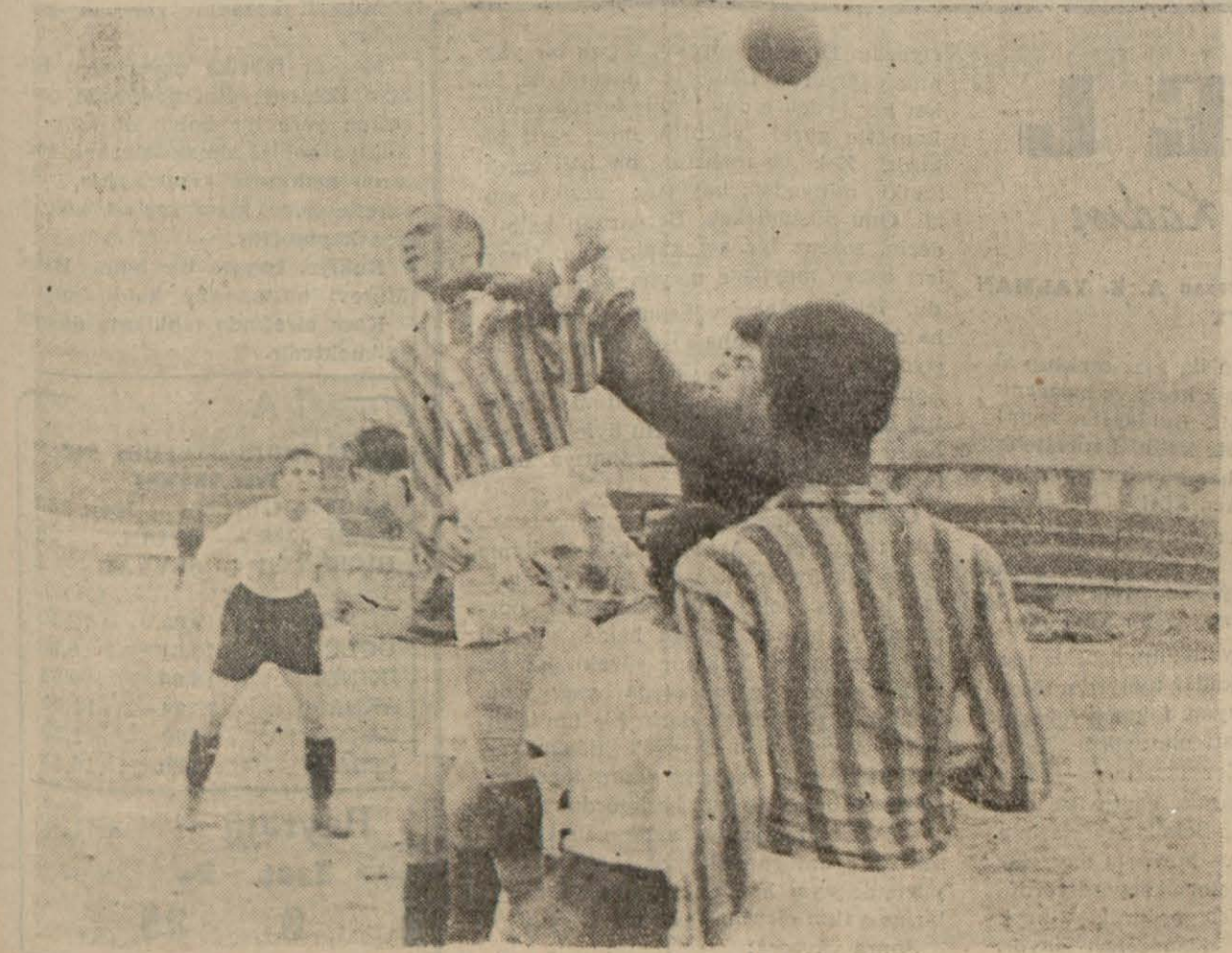
Siyah beyazlılar lehine 8 - 0 biten Beşiktaş - Kasımpaşa maçından bir görüntü

G.Saray: 8-Taksim: 0 { Beşiktaş: 8-K.Paşa: 0 İ.Spor : 6-Süleym. 1 { Vefa : 6-D.Paşa: 3 Yazısı 4 üncü sayfamızdadır.